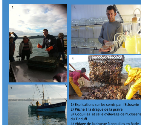
1/ Explications sur les semis par l'Écloserie 2/ Pêche à la drague de la praire 3/ Coquilles et salle d'élevage de l'Écloserie du Tinduff 4/ Vidage de la drague à coquilles en Rade