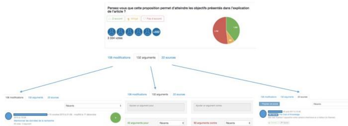
Figure 2 : Montage de captures d'écran de la page de consultation République Numérique (article 9 proposé par le Gouvernement) afin de montrer les différentes fonctionnalités offertes. Détails des votes pour, contre ou mitigé (capture d'écran du haut), amendements (capture d'écran de l'onglet « modifications » en bas à gauche de l'image), commentaires (capture d'écran de l'onglet « arguments » en bas au milieu), ajout de sources (capture d'écran de l'onglet « sources » en bas à droite).

Même si cette plateforme de la consultation pour une République Numérique a donné un formidable coup de projecteur sur la question de l' open access , elle n'est que la résultante (ainsi que les votes qui y ont été recueillis) d'un ensemble d'autres espaces où les débats se sont déployés.