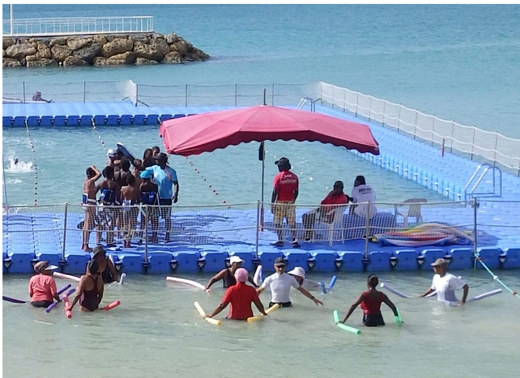
Photographie N°1: La plage du Gosier, une matinée de semaine : cours d'aquagym fréquenté par des femmes créoles et cours de natation fréquenté par des enfants créoles