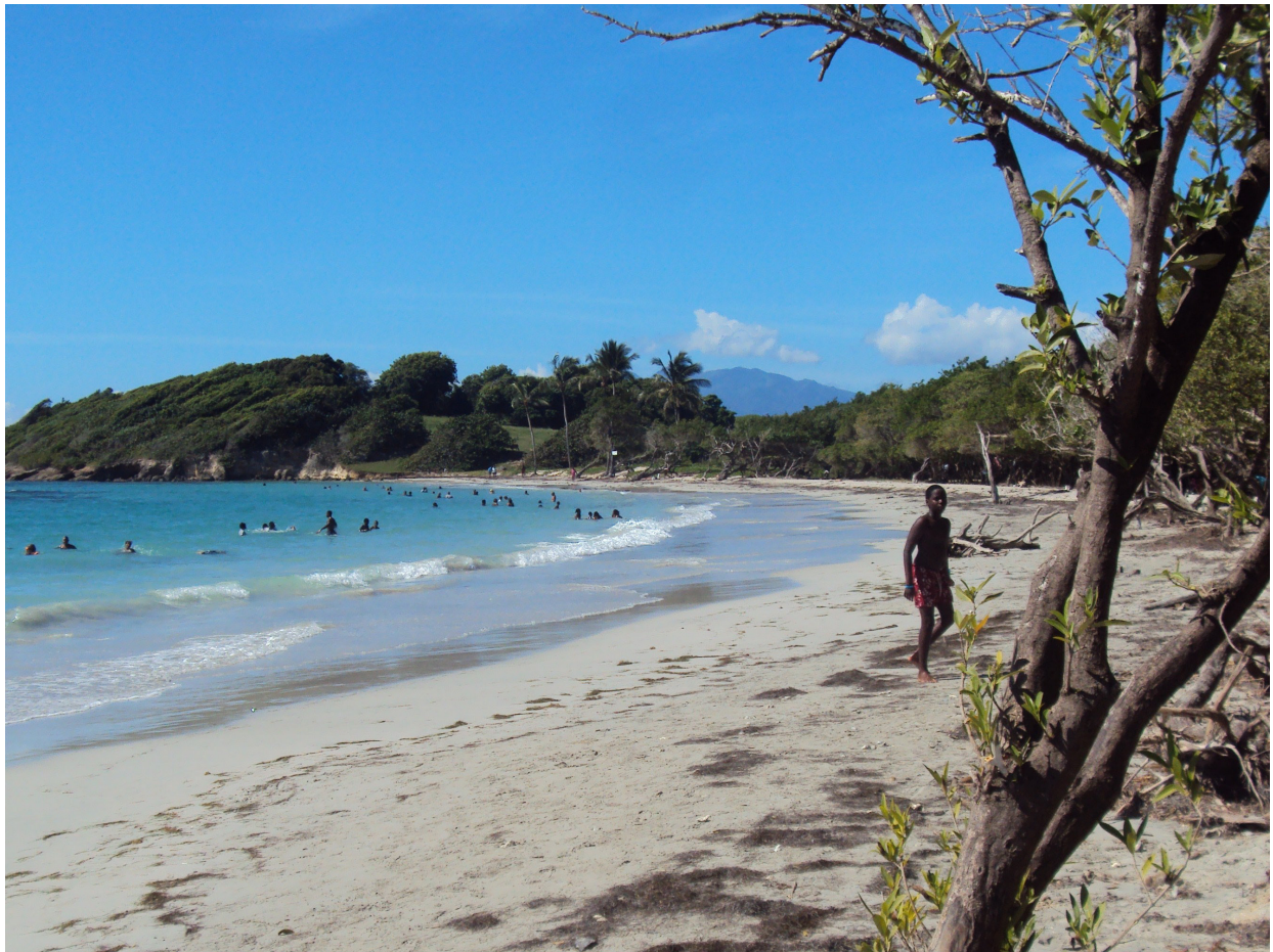
Photographie N°3 : La plage de Saint-Félix un après-midi de week-end : des baigneurs créoles qui ne font que passer sur la bande de sable chaud