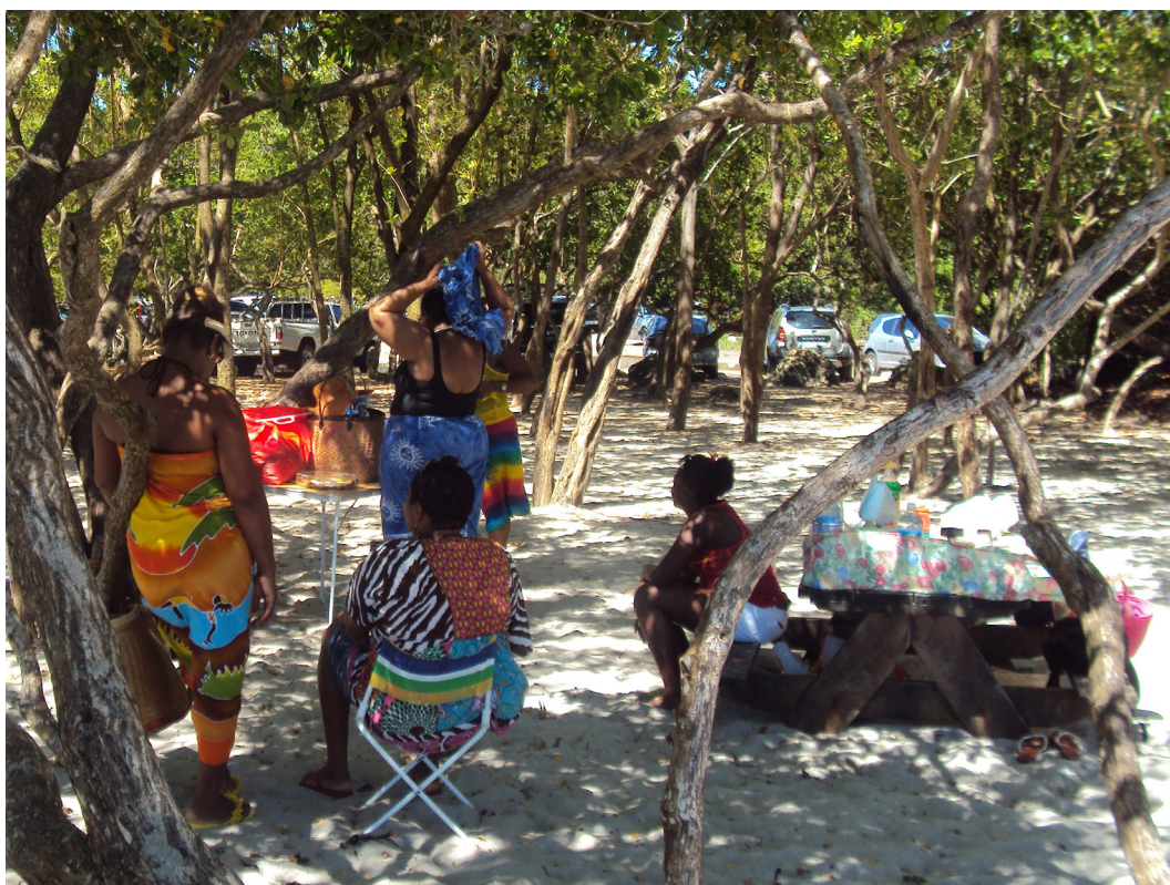
Photographie N°2 : La plage de Saint-Félix, un week-end : le pique nique créole à l'ombre du couvert végétal