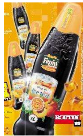
Fruiss, marque Ombrelle distribuée en GMS (ici Fruiss Sans Sucre, Fruiss Saveurs et Fruiss Ice tea)