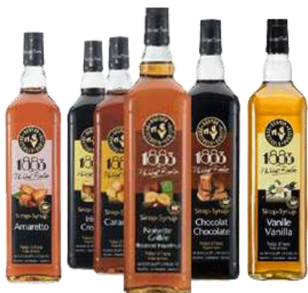
1883 Philibert Routin (Gamme sirops hors domicile)