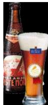
Bière Piste Noire