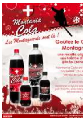
Montania Cola (cola régional)