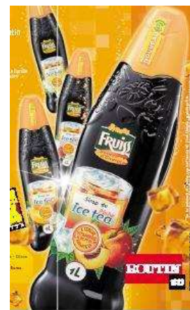
Fruiss, marque Ombrelle distribuée en GMS (ici Fruiss Sans Sucre, Fruiss Saveurs et Fruiss Ice tea)