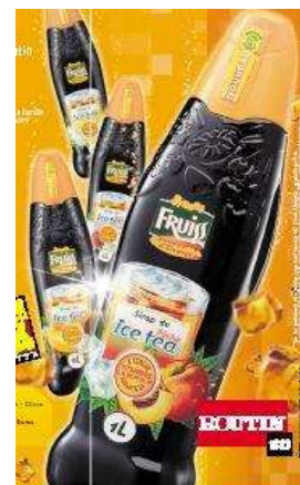
Fruiss, marque Ombrelle distribuée en GMS (ici Fruiss Sans Sucre, Fruiss Saveurs et Fruiss Ice tea)