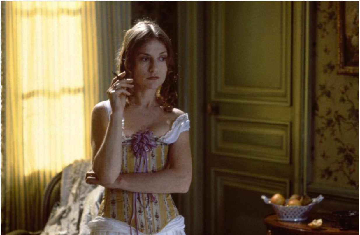
Isabelle Huppert, la Bovary de Claude Chabrol