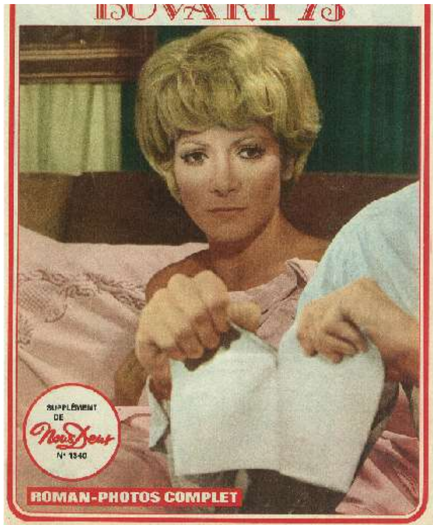
Nous Deux , mars 1973