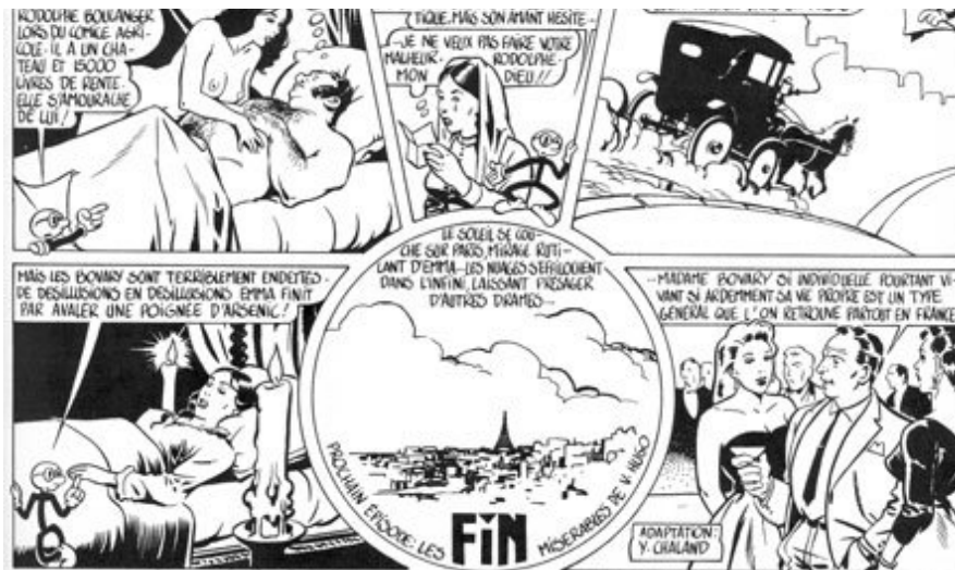
Madame Bovary résumé en une page par Yves Chaland