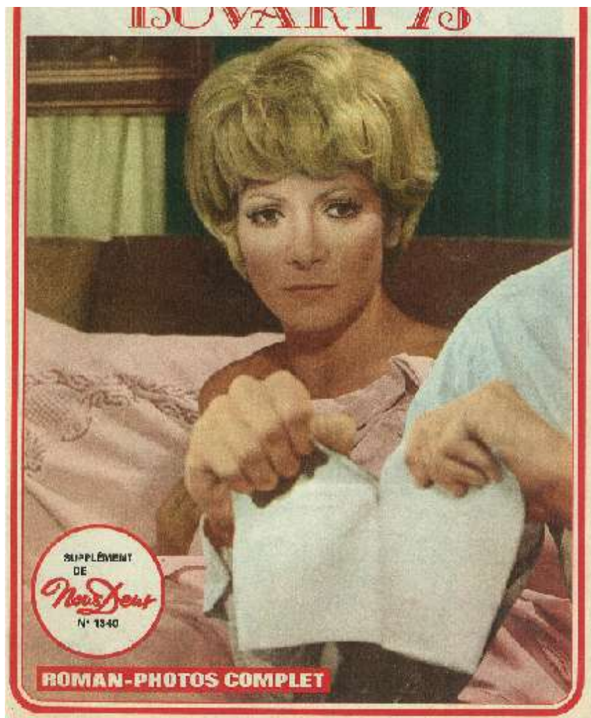
Nous Deux , mars 1973

Comme le note Pierre Bayard, en prologue de Qui a tué Roger Ackroyd ? (1998), « de nombreux décès de la littérature, et pas seulement policière, mériteraient d'être reconsidérés. (...) Est-il exclu que Madame Bovary ait été assassinée ? (...) Indépendamment du problème des morts suspectes, de multiples faits littéraires gagneraient de toute manière à être remis en perspective ou éclairés différemment ».