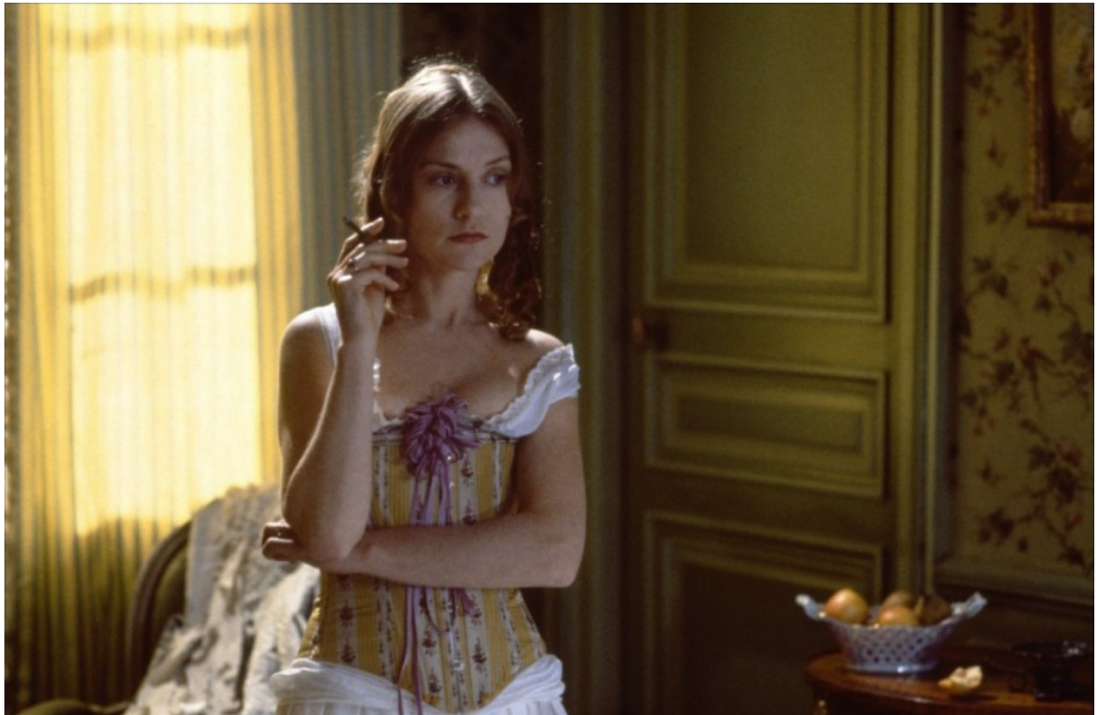
Isabelle Huppert, la Bovary de Claude Chabrol