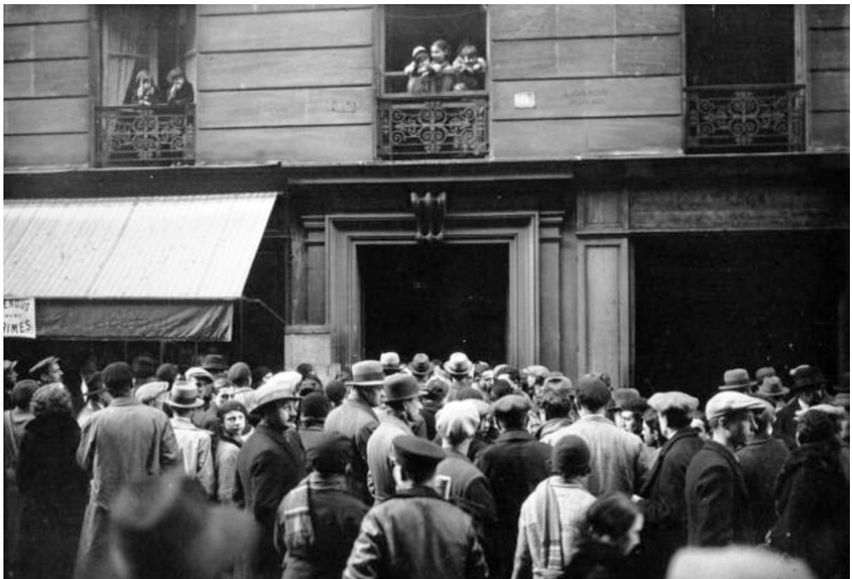
« La foule carnassière, renseignée par la presse, est au rendez-vous, massée contre la porte cochère (...) elle a

Tout commence 9, rue de Madagascar, dans un « immeuble à la façade sans prétention » du Paris populaire, creuset de fiction parce qu'il est banal et pourtant « lieu de crime » en 1933. Page 20, une photographie d'époque présente « la foule carnassière, renseignée par la presse (...) massée contre la porte cochère ». Comme dans Nadja de Breton, la photographie est effet de réel, elle tranche dans les descriptions inutiles, le noir et blanc comme le grain de l'image poétisent l'ensemble.