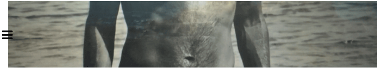
Luigi Clemente, Enter Ghost