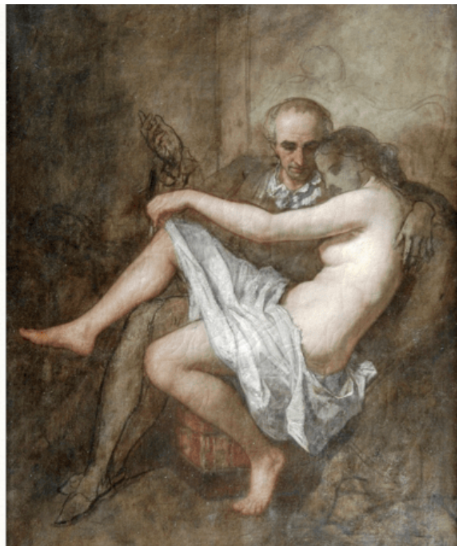
Thomas Couture, Baudelaire et Madame Sabatier

LES FLEURS DU MAL XCIII A UNE PASSANTE LA rue assourdissante autour de moi hurlait. Longue, mince, en grand deuil, douleur majestueuse, Une femme passa, d'une main fastueuse Soulevant, balançant le feston et l'ourlet ; Agile et noble, avec sa jambe de statue. Moi, je buvais, crispé comme un extravagant, Dans son œil, ciel livide où germe l'ouragan, La douceur qui fascine et le plaisir qui tue. Un éclair... puis la nuit ! – Fugitive beauté Dont le regard m'a fait soudainement renaître, Ne te verrai-je plus que dans l'éternité ? Ailleurs, bien loin d'ici ! trop tard ! jamais peut-être ! Car j'ignore où tu fuis, tu ne sais où je vais, Ô toi que j'eusse aimée, ô toi qui le savais !