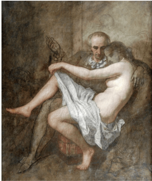
Thomas Couture, Baudelaire et Madame Sabatier

LES FLEURS DU MAL XCIII A UNE PASSANTE LA rue assourdissante autour de moi hurlait. Longue, mince, en grand deuil, douleur majestueuse, Une femme passa, d'une main fastueuse Soulevant, balançant le feston et l'ourlet ; Agile et noble, avec sa jambe de statue. Moi, je buvais, crispé comme un extravagant, Dans son œil, ciel livide où germe l'ouragan, La douceur qui fascine et le plaisir qui tue. Un éclair... puis la nuit ! – Fugitive beauté Dont le regard m'a fait soudainement renaître, Ne te verrai-je plus que dans l'éternité ? Ailleurs, bien loin d'ici ! trop tard ! jamais peut-être ! Car j'ignore où tu fuis, tu ne sais où je vais, Ô toi que j'eusse aimée, ô toi qui le savais !