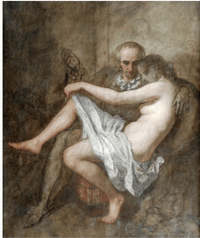
Thomas Couture, Baudelaire et Madame Sabatier

LES FLEURS DU MAL XCIII A UNE PASSANTE LA rue assourdissante autour de moi hurlait. Longue, mince, en grand deuil, douleur majestueuse, Une femme passa, d'une main fastueuse Soulevant, balançant le feston et l'ourlet ; Agile et noble, avec sa jambe de statue. Moi, je buvais, crispé comme un extravagant, Dans son œil, ciel livide où germe l'ouragan, La douceur qui fascine et le plaisir qui tue. Un éclair... puis la nuit ! – Fugitive beauté Dont le regard m'a fait soudainement renaître, Ne te verrai-je plus que dans l'éternité ? Ailleurs, bien loin d'ici ! trop tard ! jamais peut-être ! Car j'ignore où tu fuis, tu ne sais où je vais, Ô toi que j'eusse aimée, ô toi qui le savais !