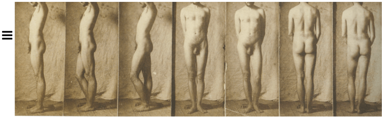
Thomas Eakins dans the Nude Series (1883)

Un bref poème de Thom Gunn, l'auteur du beau Man with night sweats , illustrerait tout aussi bien mon/notre rapport à la poésie. Il a pour titre Jamesian et se compose d'un seul distique : « Their relationship consisted / In discussing if it existed. » Saisie dans l'acte de lecture, la proposition acquiert une valeur poétique : les deux amants litigieux, hypothétiques personnages du concierge de génie que fut Henry James romancier, figurent le couple formé par le poème et son lecteur, réunis dans le trompe-l'œil de ce trop brillant distique. Autrement dit : le rapport du poème et de son lecteur consiste à remettre en question l'existence de ce rapport. D'un principe d'incertitude quant à l'existence du poème dépend la réalité de la relation poétique.