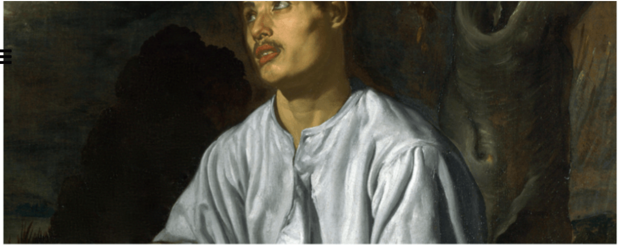
Diego Velasquez, Saint Jean à Patmos