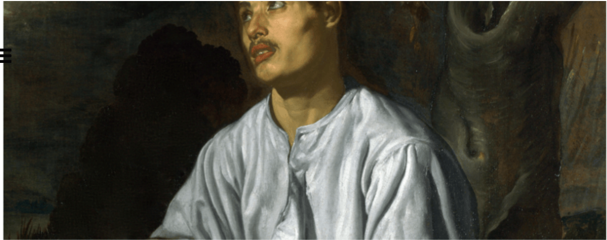
Diego Velasquez, Saint Jean à Patmos