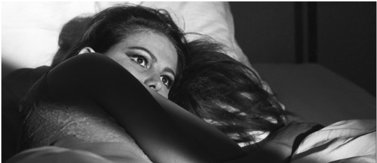
Claudia Cardinale dans Vaghe Stelle dell'Orsa (vf : Sandra ) de Luchino Visconti

le présent éternel du temps mythologique. Par le truchement de l'image, les étoiles se transforment en cette troupe des nymphes qui suivent Diane Chasserresse dans ses courses en forêt. Cette addition de Chénier au poème qu'il imite signe le sens profond qu'il donne à son idylle. Il dit de sa « nymphe adorée » qu'elle est « belle entre les belles », or la plus belle des nymphes de Diane n'est autre que Callisto — nom dérivé de kalos dans sa forme superlative : Kallistè ou « la plus belle ». En tant que suivante de Diane-Artémis, Callisto devait rester pure : violée par Zeus et incapable de cacher sa grossesse aux yeux de Diane avec qui elle se baignait nue, elle fut d'abord changée en ourse et puis en la constellation : la Grande Ourse ou Ursa Major . Cette triste histoire de la nymphe Callisto figure sous forme d'allusion dans les « feux si purs » dont brille l'étoile de Chénier. L'amoureux courait dans la nuit « trouver des ardeurs mutuelles » ; il allait, à l'instar de Zeus, souiller sa « belle entre les belles ». La nuit étoilée le sidère et il s'arrête en chemin. Aux feux sensuels de l'idylle se substituent les « feux si purs » de l'étoile ravissante qui métamorphose l'amoureux en poète contemplatif, lui fait oublier sa nymphe, l'ouvre à l'amour sans objet du ravissement poétique. « Le poème est l'amour réalisé du désir demeuré désir », écrivait René Char. Chénier l'avait dit autrement, par le biais d'une addition dans une idylle érotique changée en poésie pure.