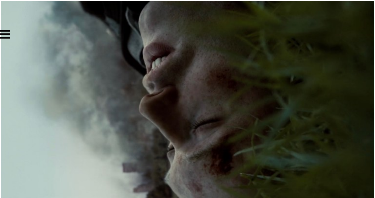
La mort de Hud

Cloverfield assimile ainsi, dans un même dispositif, angoisse de la séparation (SAD) et mue imaginaire du monde (stade imago). L'événement « apocalyptique » provoquant à la fois la destruction et le devenir-image (ou révélation) de New York assimile en profondeur trauma de séparation et formation réactive d'un univers iconique de purs émetteurs/récepteurs immédiatement synchrones. On retrouve dans ce couplage conceptuel entre séparation et devenir-image l'assise théorique dont se servait Guy Debord pour fonder sa critique du capitalisme intégré. La première partie de La Société du spectacle (1967) a pour titre : La Séparation achevée . Cette séparation, formulée dans le premier fragment, se définit ainsi :