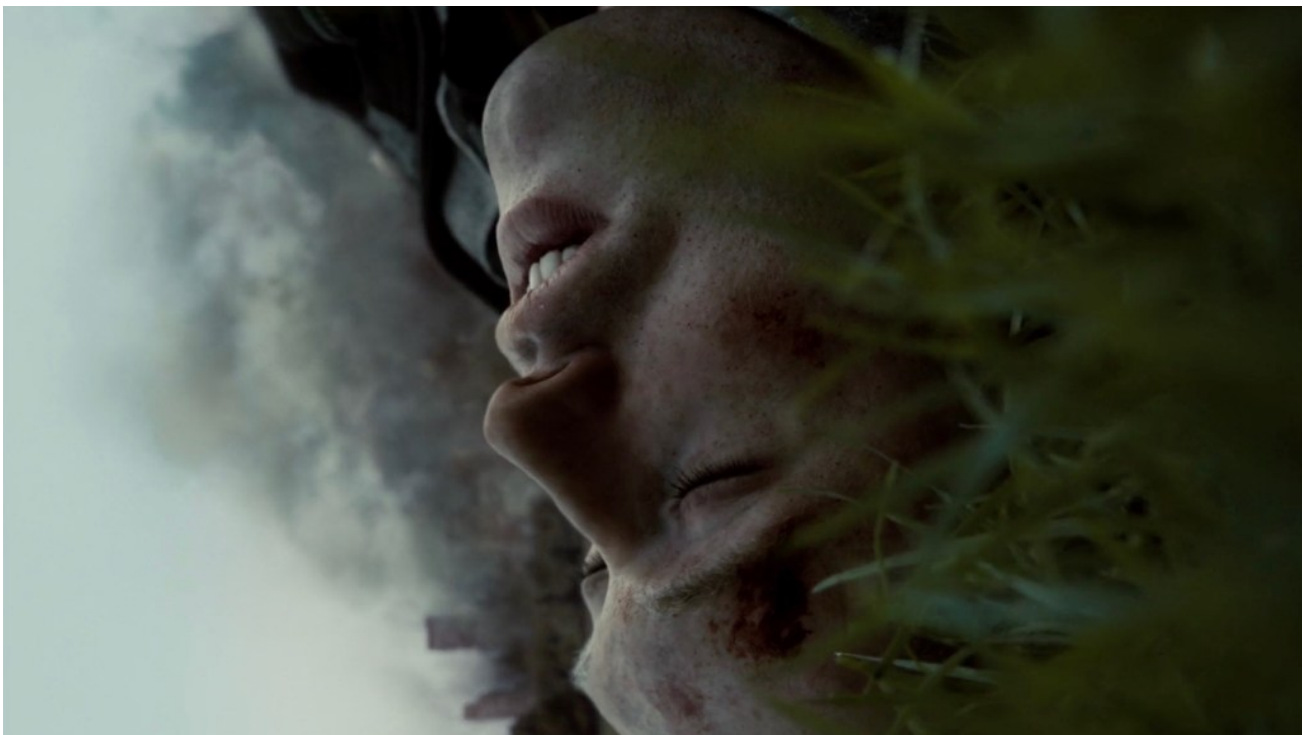
La mort de Hud

« Tout ce qui est apparaîtra ». ( Dies irae )