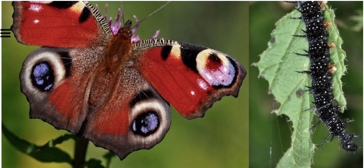
Paon du jour, Aglais Io (stade « imago » et chenille)

Chez certains lépidoptères, le dernier stade de la croissance (de la chenille au papillon) s'appelle le « stade imago ». La vie cachée de l'insecte quitte le monde de la présence et se déploie dans l'image d'une peinture volante. On appelle « mue imaginale » cette dernière éclosion qui prévient de très près la mort. Cloverfield raconte cela : l'ultime mue du genre humain accédant au « stade imago ». De l'expérience vécue, il ne reste qu'une série d'images subsumant la vie dans le non-vivant.