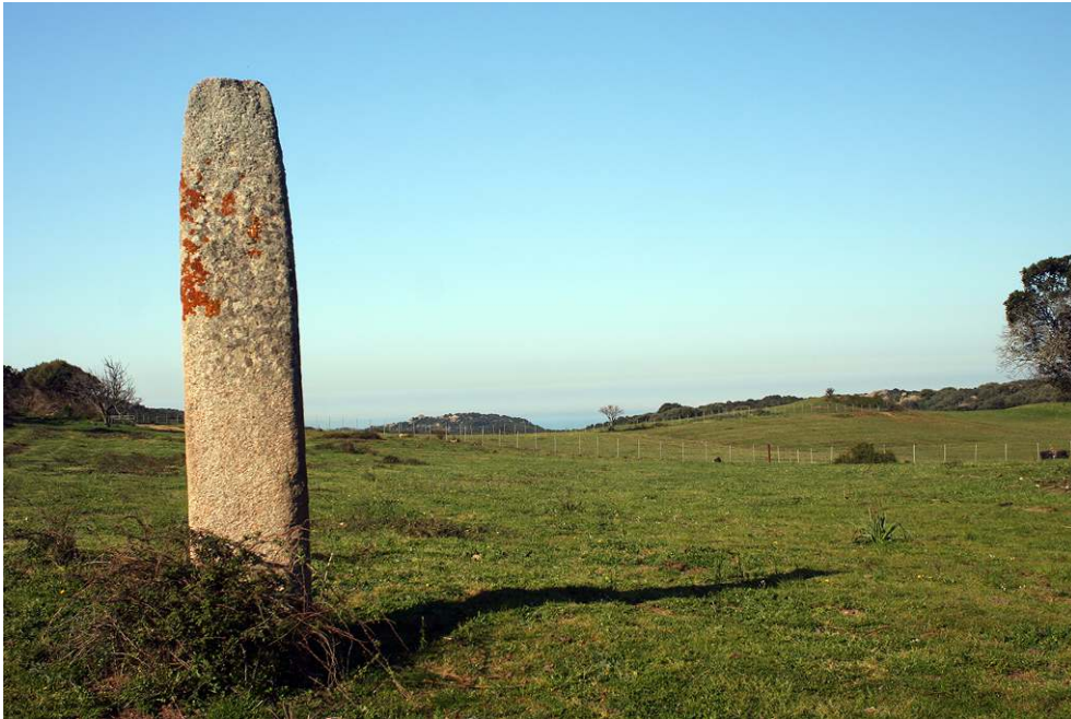
Fig. 1 – VUE GÉNÉRALE DU MENHIR EN PLACE