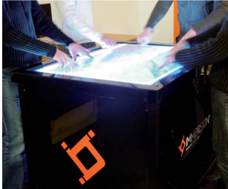
Fig. 2. Visualisation collaborative sur la table Immersion.

proposent des approches différentes mais plus adaptées à de grands écrans. La première fonctionne, sur un bureau, comme une souris classique mais un ensemble de capteurs permet de détecter également les mouvements de la souris dans l'air. Le contrôle reste cependant purement en 2 dimensions, au contraire de la SpaceNavigator proposant 6 degrés de liberté (3 translations et 3 rotations). Tous ces contrôles sont concentrés en un seul bouton, qui présente alors l'inconvénient d'être difficilement utilisable sans entraînement préalable.