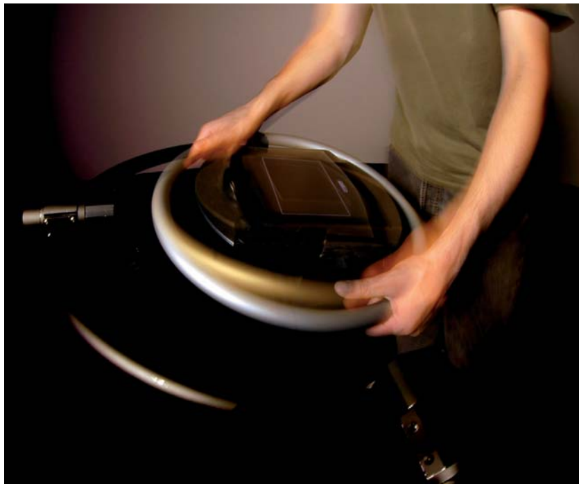
Fig. 4. Le CAT, collaboration Inria-Futurs et Immersion..