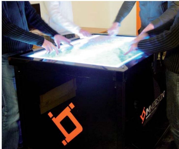
Fig. 2. Visualisation collaborative sur la table Immersion.

proposent des approches différentes mais plus adaptées à de grands écrans. La première fonctionne, sur un bureau, comme une souris classique mais un ensemble de capteurs permet de détecter également les mouvements de la souris dans l'air. Le contrôle reste cependant purement en 2 dimensions, au contraire de la SpaceNavigator proposant 6 degrés de liberté (3 translations et 3 rotations). Tous ces contrôles sont concentrés en un seul bouton, qui présente alors l'inconvénient d'être difficilement utilisable sans entraînement préalable.