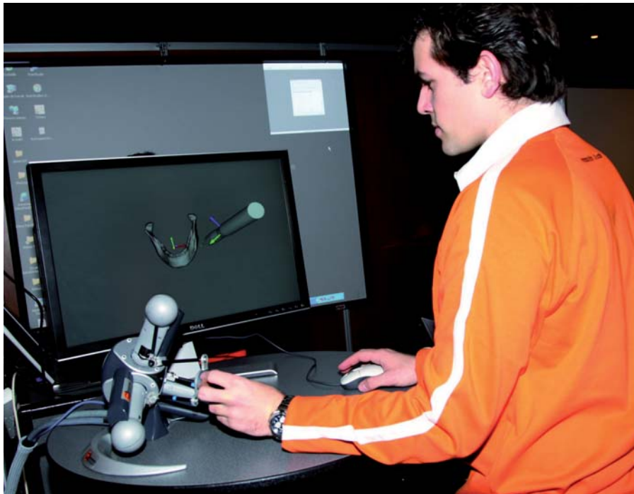
Fig. 3. Le Virtuose d'Haption.