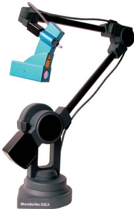
Fig. 1. Microscribe.