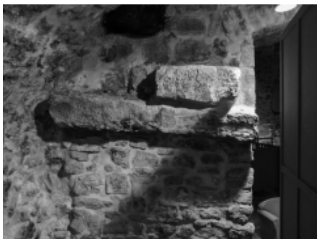
Fig. 53 – AIX-EN-PROVENCE, centre-ville. Une partie des blocs visibles dans la cave du 24 rue Gaston de Saporta.

◆ Tout d'abord, deux sites ont apporté des informations sur le cadre urbain antique : au 6 de la rue Littera, de possibles vestiges de voie romaine ont été relevés dans une cave voûtée. Il s'agit d'un ensemble de blocs qui correspondraient au cardo déjà observé en 1984 par Roger Ambard dans les caves du 4 de la même rue et au 7 par Jean-Louis Charrière. Au 24 rue Gaston de Saporta, à la suite de la découverte des vestiges du cardo maximus et de son égout axial, lors d'un sauvetage urgent sous la chaussée actuelle, une prospection a été faite dans l'une des caves de l'immeuble. Bien qu'elle ait été entièrement restaurée, ont pu y être observés plusieurs blocs qui pourraient appartenir soit à la voie, soit au forum. L'orientation et les alignements des blocs s'inscrivent avec cohérence dans la trame urbaine antique connue alentour (fig. 53).