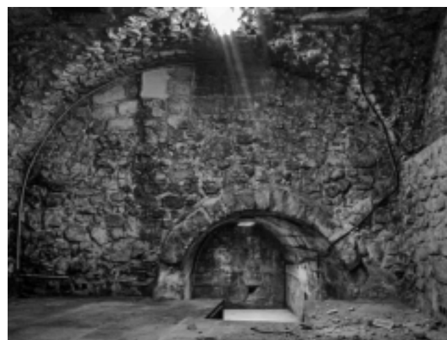
Fig. 55 – AIX-EN-PROVENCE, centre-ville. Vue depuis l'ouest de la cave et de l'espace souterrain sous la rue Thiers.

• D'autre part, suite à un changement de propriétaire au 24 rue Thiers, une observation rapide de la cave nous a été accordée. Vaste, cet espace comprend plusieurs cellules dont une partie semble se situer sous la rue Thiers. Il s'agit d'une petite salle voûtée, très différente des autres espaces de la cave. Elle pourrait correspondre à des vestiges de réseaux anciens ou une partie d'un pont. Ce secteur est connu comme l'ancienne entrée de ville médiévale à partir du XV e s. avec la porte Saint-Jean au devant de laquelle un pont en pierre, le pont Moreau, « permettait d'enjamber le fossé qui conduisait l'eau au moulin et qui baignait les remparts dans cette partie » (Roux-Alphéran 1846, vol. 2, 237) (fig. 55).