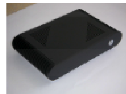
Figure 4 : Ordinateur domestique

L'ordinateur domestique (Figure 4) se caractérise par un encombrement réduit équivalent à un lecteur CD, une faible consommation d'énergie, et un niveau sonore minimum. Il est connecté à un modem ADSL, éventuellement via une liaison Wi-Fi, permettant l'accès au réseau Internet. Ce dispositif matériel est complété par un avertisseur sonore ou visuel (suivant les desiderata des personnes interrogées) qui est activé lors du dépôt d'un nouveau média [7].