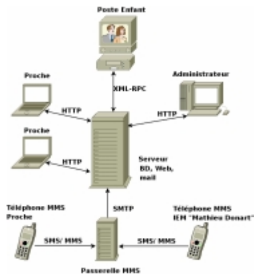
Figure 1. Architecture de la plate-forme.