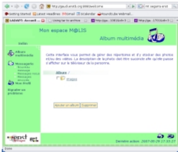
Figure 5 : Interface WEB « Personne de l'Entourage »

mobile SFR a mis à disposition des utilisateurs des téléphones munis de la fonction MMS, qui permettent de transmettre à l'enfant et ses parents des messages ou des photos instantanément. Ainsi, l'un des téléphones a été mis à la disposition d'une tante de l'un des enfants, et d'autres ont été remis aux professionnels de l'IEM. Simple d'utilisation, nous espérons que ces téléphones répondent en partie aux contraintes de temps exprimés par les professionnels lors des diverses rencontres.