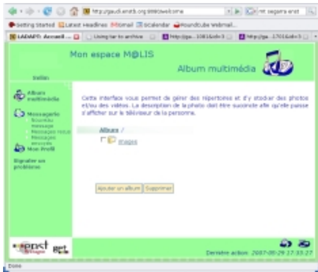
Figure 5 : Interface WEB « Personne de l'Entourage »

mobile SFR a mis à disposition des utilisateurs des téléphones munis de la fonction MMS, qui permettent de transmettre à l'enfant et ses parents des messages ou des photos instantanément. Ainsi, l'un des téléphones a été mis à la disposition d'une tante de l'un des enfants, et d'autres ont été remis aux professionnels de l'IEM. Simple d'utilisation, nous espérons que ces téléphones répondent en partie aux contraintes de temps exprimés par les professionnels lors des diverses rencontres.