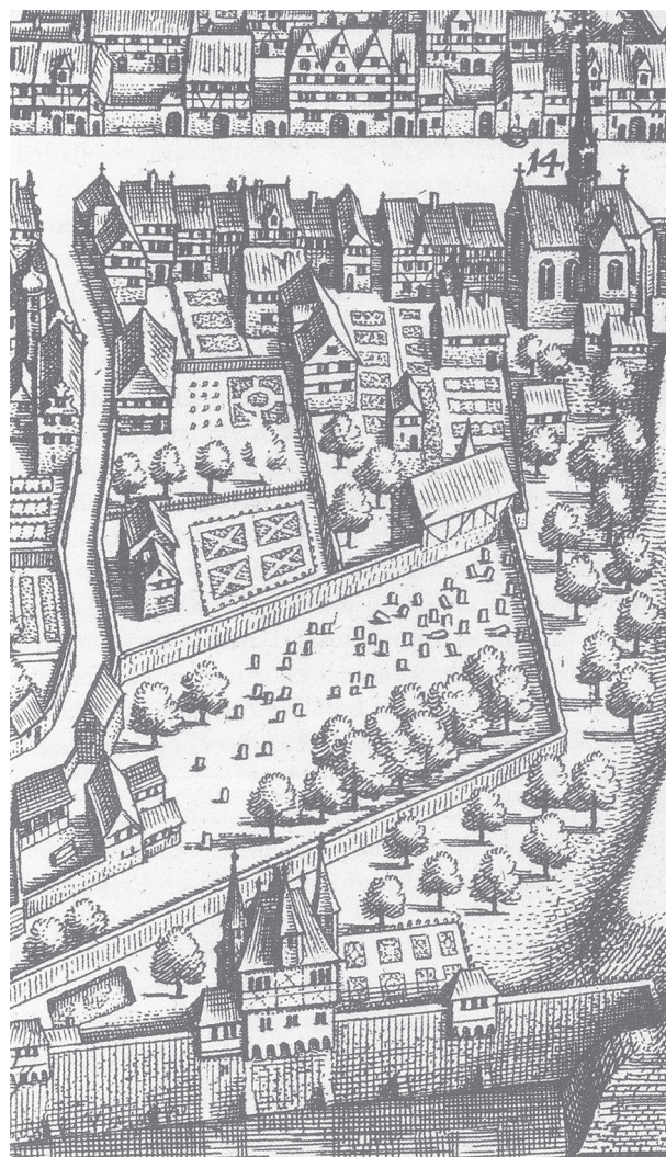
Fig. 9 : Vue du cimetière juif de Francfort-sur-le-Main (Allemagne) en 1628 par Mattäus Merian. On y distingue plusieurs arbres et à gauche un groupe de bâtiments à proximité de l'entrée décrits comme un hôpital, une maison de purification et des étables (JACOBS 2008 : 43).