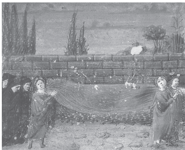
Fig. 3 : En Italie, vers la fin du XV e s. : le cortège funèbre arrive au cimetière (Source : Princeton, University Library, Ms Garrett 26, folio 57 recto, in METZGER et METZGER 1982 : 80).

L'iconographie et les documents de la période moderne évoquant cette matérialisation par des murs sont plus nombreux (Fig. 5).