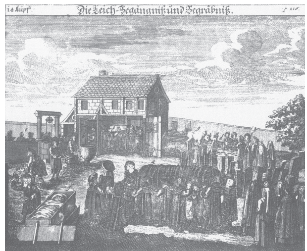
Fig. 7 : Vue de détail du cimetière de Fürth lors de l'inhumation d'un défunt. Le bâtiment en arrière-fond semble avoir été utilisé pour la préparation du corps ( Tahara ) (JACOBS 2008 : 85).

Les indices relatifs à ce type de bâtiment ne sont visibles que sur des représentations postérieures à la période médiévale (Fig. 5 et 7). Une seule opération archéologique pourrait avoir mis au jour des vestiges liés à un tel bâtiment mais sa fonction réelle demeure incertaine (maison du gardien ou pour la purification ?). En effet, à Ennezat, Daniel Parent (2011 : 242) a découvert lors d'un diagnostic, deux grandes structures fossoyées d'au moins 6 m de côté, profondes d'1 m et comblées par du matériel de démolition et de la céramique (XIII e -XIV e s.).