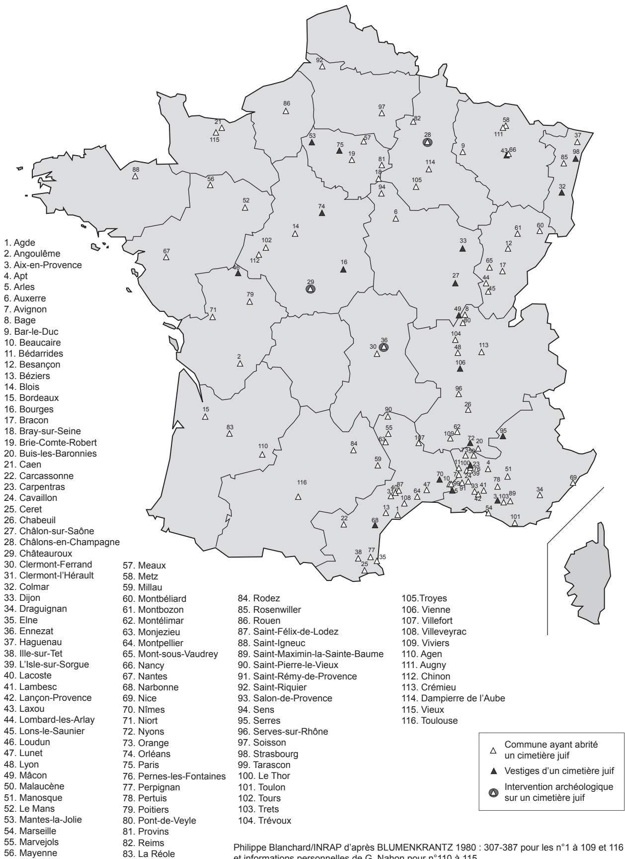
Fig. 1 : Localisation des communes françaises ayant abrité au moins un cimetière juif entre le XI e et XVI e s. d'après l'inventaire réalisé en 1980 par l'équipe de la Nouvelle Gallia Judaica et complété depuis par Gérard Nahon (Ph. Blanchard/Inrap).