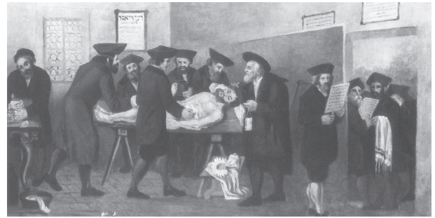
Fig. 6 : Vue de la toilette mortuaire pratiquée par les membres de la Hevra Qaddisha sur une peinture anonyme du XVIII e s..

Les indices relatifs à ce type de bâtiment ne sont visibles que sur des représentations postérieures à la période médiévale (Fig. 5 et 7). Une seule opération archéologique pourrait avoir mis au jour des vestiges liés à un tel bâtiment mais sa fonction réelle demeure incertaine (maison du gardien ou pour la purification ?). En effet, à Ennezat, Daniel Parent (2011 : 242) a découvert lors d'un diagnostic, deux grandes structures fossoyées d'au moins 6 m de côté, profondes d'1 m et comblées par du matériel de démolition et de la céramique (XIII e -XIV e s.).