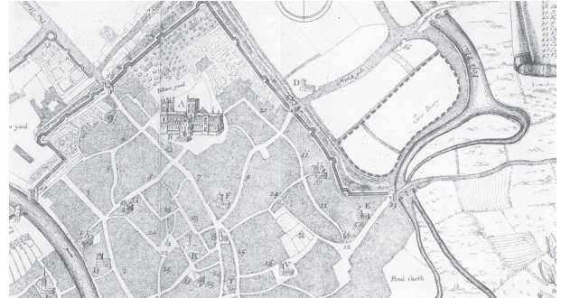
Fig. 2 : Localisation du cimetière juif de York en dehors de l'enceinte médiévale sur un plan de 1766 (JACOBS 2008 : 49).

Les sources sont unanimes pour placer le cimetière juif en dehors de la ville alors que les communautés vivaient au sein des limites urbaines (Fig. 2). Il ne faut pas voir une exclusion des juifs du fait des chrétiens. Cette localisation extra muros est voulue par les communautés juives et répond à des considérations qui leur sont propres. En effet, dans le judaïsme, la notion de pureté est essentielle et il est par conséquent important d'inhumer en terre vierge d'une part, loin de l'espace des vivants d'autre part, le contact d'un mort étant un facteur d'impureté. Pour ce dernier motif, les Cohanim , lignée sacerdotale descendant d'Aaron, frère de Moïse, devant impérativement éviter tout contact avec des cadavres, il convient selon la Mishna de Baba Batra II, 9, de placer les lieux funéraires à cinquante coudées (25 m) des lieux de vie quotidiens.