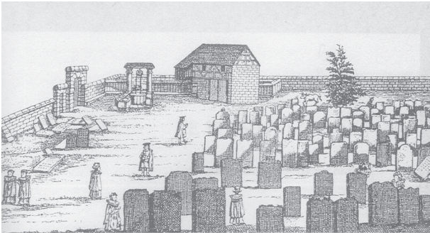
Fig. 5 : Vue du cimetière de Fürth avec son mur de clôture, ses accès et ses bâtiments communautaire (JACOBS 2008 : 85).

Ces éléments sont visibles aussi sur quelques représentations à Prague, à Fürth, à Venise ou à Amsterdam (Fig. 5).