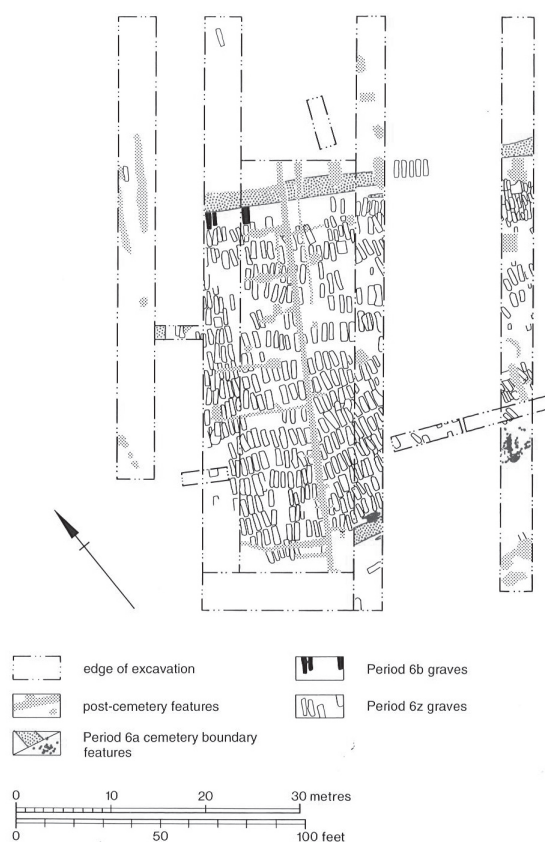
Fig. 4 : Plan du cimetière juif de York limité par des fossés (LILLEY et al. 1994 : 322).

de la communauté ne doivent pas rentrer en contact avec des corps en putréfaction. De la même façon, tout ce qui a pu toucher les cadavres leur est inaccessible. Par conséquent, tout Cohen a pour obligation d'éviter les cimetières afin de se soustraire au risque d'impureté. Cette disposition est si forte que les Cohanim ne doivent pas entrer en contact avec les branches ou les feuilles d'un arbre dont les racines pouvaient toucher le corps d'un défunt. Ainsi, si la matérialisation physique d'une zone sépulcrale répond à un certain pragmatisme (prévention des dégradations), elle correspond aussi à une prescription de la loi juive.