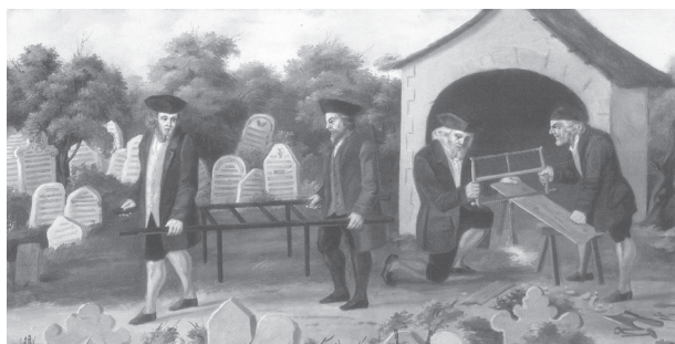
Fig. 8 : Vue de la fabrication du cercueil de bois dans le cimetière de Prague. Sur cette vue anonyme du XVIII e s., on distingue une certaine végétation en arrière-plan.

Les vues de la période moderne sont plus nombreuses et livrent le plus souvent un paysage agréable avec des arbres et/ou arbustes (Fig. 8 et 9). On ne peut cependant écarter l'hypothèse selon laquelle ces représentations de paysages funéraires idylliques relèveraient plus de l'artifice iconographique que de la réalité.