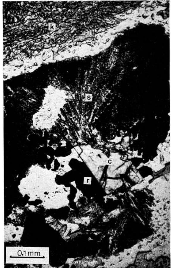
FIG. 2. — Corindon primaire ( c ) en association épitaxiale avec le rutile ( r ) dans la symplectite corindon II + quartz ( s ) dérivant du disthène. Noter le contact plan entre les deux minéraux. Comparer avec Lasnier (1977), photos 61 à 64. K = kélyphitoïde.

Le corindon primaire est le plus souvent situé au voisinage du disthène. Il est rarement inclus dans le grenat et se présente en tablette ne dépassant pas 0,5 mm. Il se distingue nettement du corindon II par son mode d'association épitaxiale avec le rutile, ce qui semble confirmer, comme l'a remarqué Lasnier (1977), son caractère primaire (fig. 2).