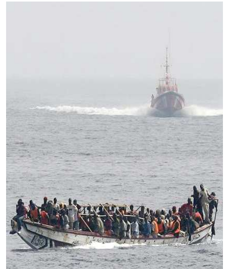
« Cayuco approached by a Spanish coast guard vessel » par Noborder Network (2008) - CC BY 2.0

Or les clandestins sont peu visibles dans les données officielles. Face à cette difficulté, la base de données établie par l'Institut pour l'étude de la multi-ethnicité (ISMU) est une source fiable pour décrire la situation des migrants en Italie, où la part des sans-papiers est importante.