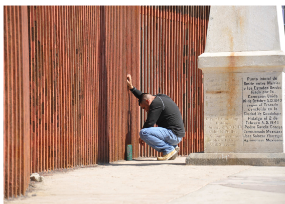
« This man has said goodbye to his partner through the border fence » (frontière entre le Mexique et les États-Unis)

En Italie, le statut légal agit sur la consommation à la fois parce qu'il contraint le niveau des revenus des sans-papiers et parce que le risque d'expulsion incite à la prudence donc à l'épargne. La situation américaine, par exemple, ne présente pas les mêmes caractéristiques car les pouvoirs publics luttent contre la clandestinité davantage par des contrôles aux frontières que par des expulsions. Ainsi les sans-papiers qui parviennent à entrer sur le sol américain sont exposés à un risque d'expulsion très faible. En revanche, dans d'autres pays où il est élevé, ce qui est le cas de la France 10 , le risque d'expulsion peut permettre de comprendre le comportement de consommation des sans-papiers.