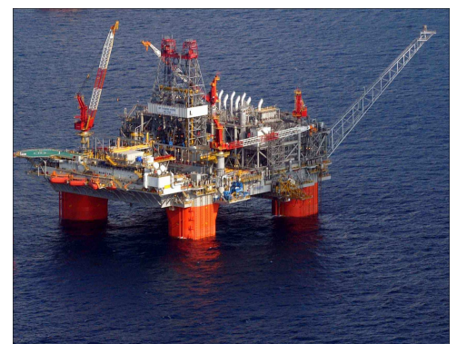
Thunder Horse semi-submersible platform, par Andyminicooper (2005) CC BY-SA

Pour savoir si une ressource profite de la taxe, il faut donc savoir quel effet agit le plus nettement : la rente des propriétaires diminue-t-elle (si l'effet de capture domine, comme le craignent les pays de l'OPEP) ou augmente-t-elle (si l'effet de substitution l'emporte) ? En écho au Green Paradox 8 , Renaud Coulomb et Fanny Henriet appellent Grey Paradox la situation où la taxe carbone pourrait faire augmenter les profits des pays de l'OPEP.