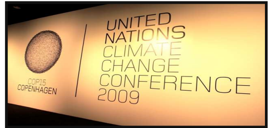
COP15 Copenhagen, par Magnus Manske, CC BY-SA

Pour évaluer le poids de chacun des deux effets d'une taxe carbone sur les différentes énergies fossiles, le modèle proposé représente un monde stylisé, basé sur des hypothèses simples concernant les stocks, les coûts d'extraction et les niveaux de pollution des différentes ressources énergétiques. Dans ce modèle comme dans la réalité, les ressources de l'OPEP sont en concurrence avec d'autres ressources encore plus polluantes (par exemple le charbon) ainsi qu'avec une ressource non polluante (le solaire) plus chère à produire (fabrication et installation de panneaux solaires). À partir des objectifs de réduction d'émission de CO 2 adoptés lors de la conférence de Copenhague en 2009, les auteurs déterminent les caractéristiques d'une taxe carbone optimale permettant d'atteindre les objectifs d'émissions de carbone au moindre coût pour les consommateurs.