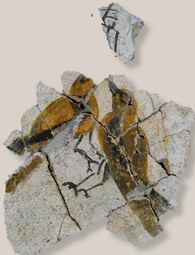
3. Martigues, deux grives suspendues par le bec. Cette représentation d'une nature morte animalière est le seul exemple connu en Gaule, à ce jour. Elle témoigne des pratiques alimentaires décrites par Columelle.