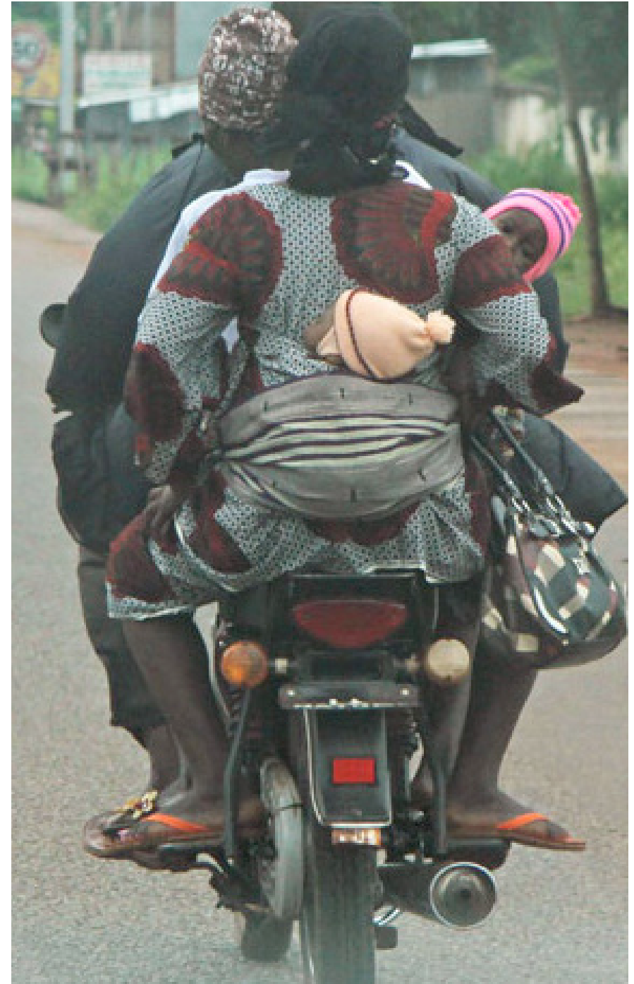
Djougou, Bénin, 2013. J.P Rolland.

La dernière difficulté réside dans la divergence éventuelle entre militantisme et rigueur de la recherche lors de la phase d'opérationnalisation. Pendant que l'acteur veut des éléments pour nourrir son militantisme, le chercheur cherche à tout prix la fiabilité des résultats et l'objectivité des analyses même si ca ne va pas nécessairement dans le sens des contenus que les acteurs de terrain veulent donner à leurs activités de plaidoyer.