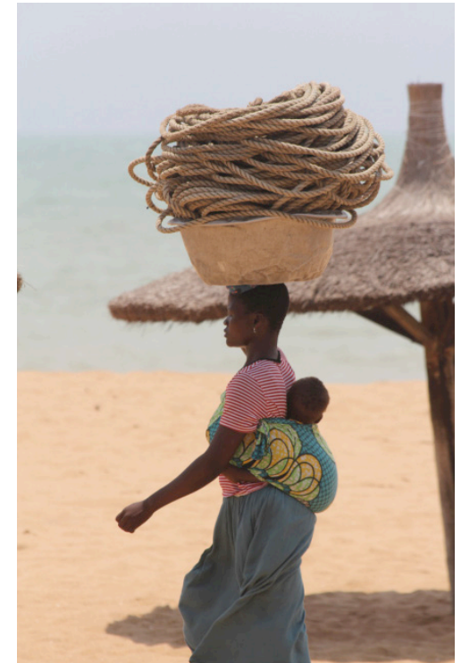
Ouidah, Bénin, 2012. J.P Rolland.

Parallèlement, dès les années 1970, le continent africain et les multiples sociétés qui le composent ont fait l'objet de nombreuses études anthropologiques qui ont eu pour objectifs tour à tour d'illustrer la subordination des femmes sur le continent, puis de mettre en exergue les pouvoirs détenus in fine par les femmes dans des processus complexes d'appropriation et de stratégies spécifiquement déployées par les femmes 29 , d'autres auteurs ont souligné la complémentarité des pouvoirs masculins et féminins. Dès cette époque, des anthropologues considèrent que le genre est une dimension essentielle à penser dans le cadre des réflexions sur le développement. En 1970, Esther Boserup montre que, non seulement l'impact des projets de développement ne soutenait pas nécessairement les femmes, mais contribuait souvent à diminuer leurs prérogatives. Par l'action en développement trop souvent : « Le système d'oppression patriarcale de leurs propres sociétés fut renforcé par le nôtre ; un double système de pouvoir masculin se mit en place accentuant la subordination et la marginalisation économique des femmes avec leurs enfants » (Bisilliat & Verschuur,