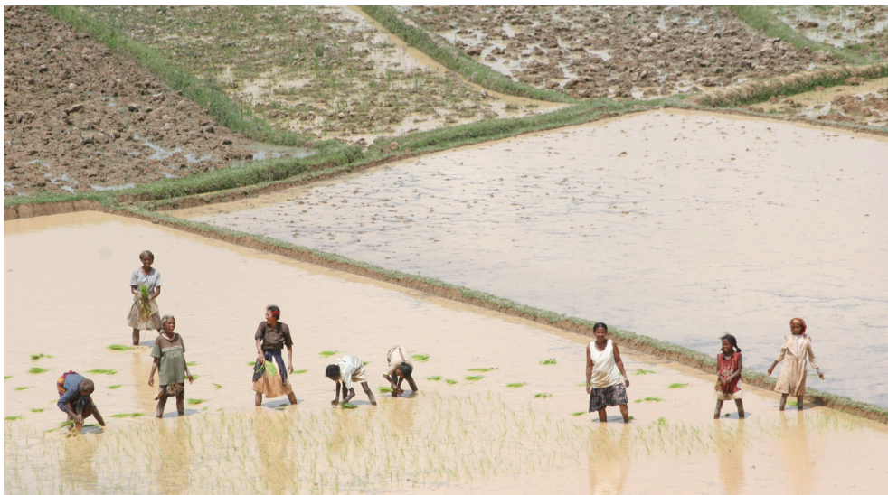
Sahambavy, Madagascar, 2006. J.P Rolland.

analyses sur les risques encourus par les veuves par le refus de lévirat apparaissent dix ans plus tard particulièrement pertinentes. Une recherche sur la recomposition des liens de sociabilité des Personnes vivant avec le VIH (PvVIH) menée au Burkina Faso 24 au cours des années 2000 mettait en évidence l'importance des discriminations et des pratiques d'exclusion des veuves, induites notamment par l'abandon du lévirat. Mais toutes ces analyses produites pendant 10 ans sur l'induction de préjugés à l'égard des femmes par cette référence au lévirat n'ont pas suffi à transformer le contenu de tous les messages qui circulent en Afrique.