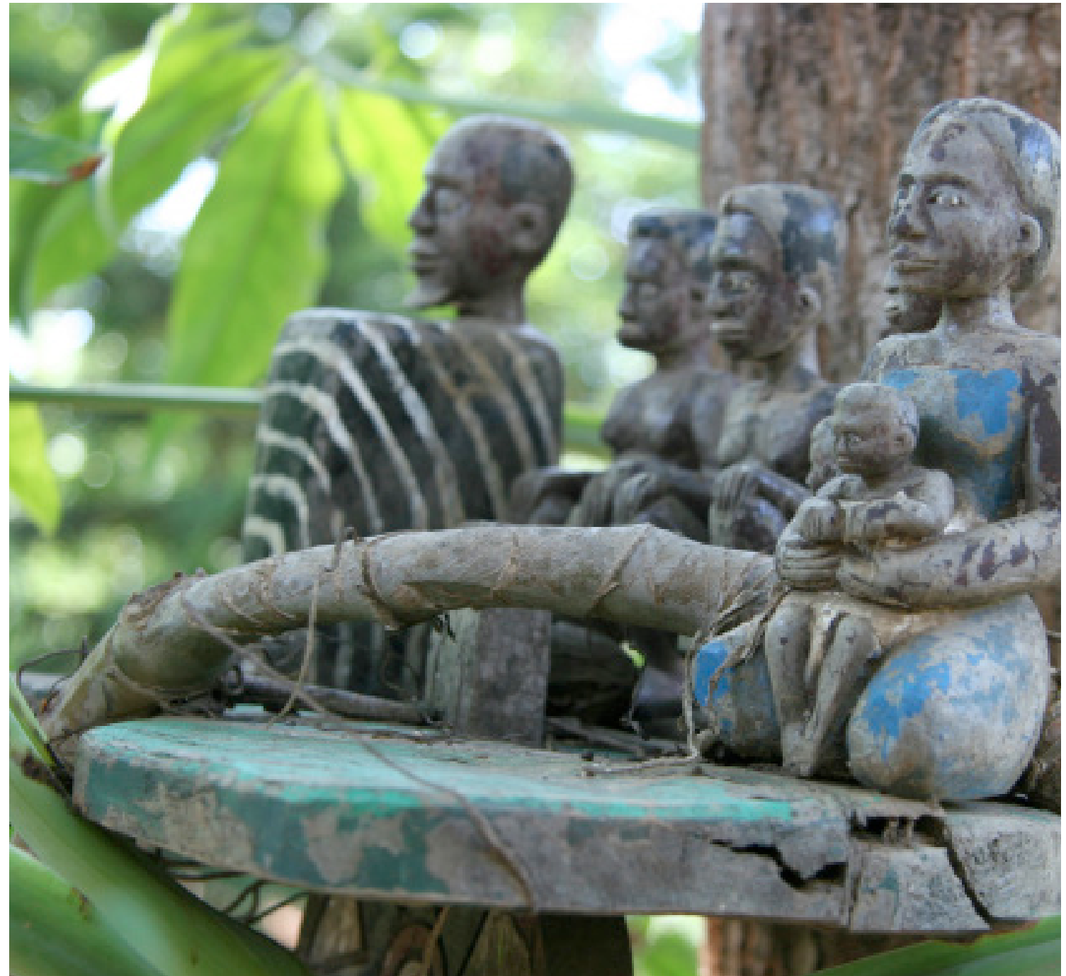
Tulear, Madagascar, 2006. J.P Rolland

A Dakar, comme dans beaucoup de villes africaines encore aujourd'hui, la contraception moderne est très largement perçue comme un moyen de débauche imposé par l'occident. Y recourir, surtout lorsqu'on est jeune et femme est alors souvent une source de culpabilité. Seules celles qui possèdent un certain capital social et éducatif sont plus à même d'assumer ce qui représente aux yeux de la société une inconduite. Les politiques et programmes qui visent la réduction des grossesses non prévues devront admettre la nécessité de réduire le coût psychologique du recours à la contraception en « destigmatisant » la sexualité des jeunes filles et en leur reconnaissant le droit à un libre contrôle de leur corps. Ces conditions dépassent le simple cadre de la santé sexuelle et reproductive et impliquent une prise en compte globale de la réduction des inégalités entre hommes et femmes dans les différents domaines de la vie publique et privée.