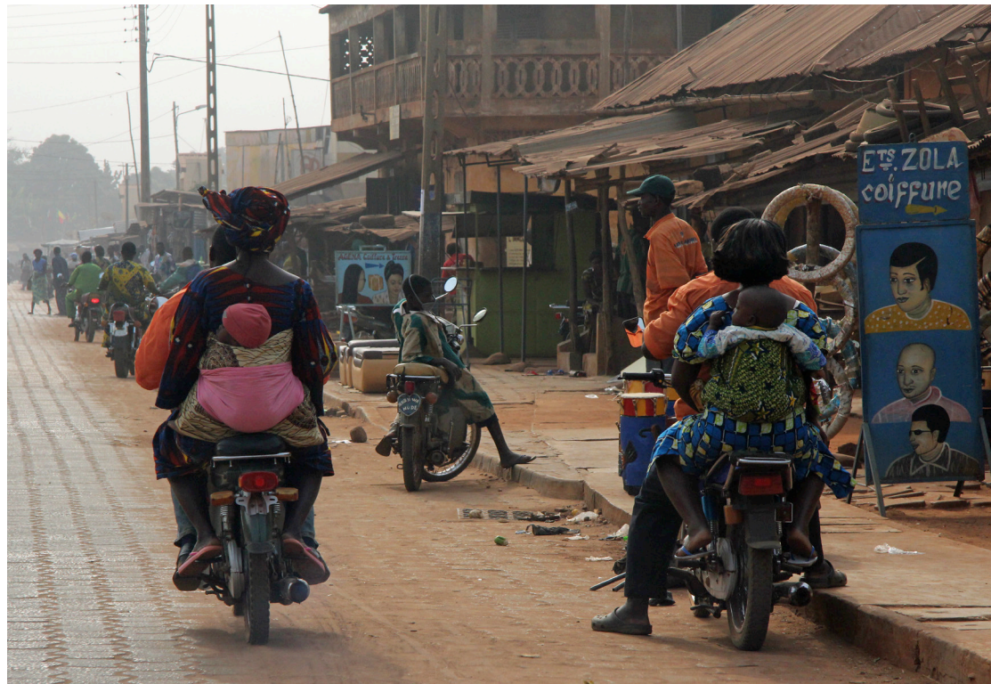
Abomey, Bénin, 2012. J.P Rolland.

reconfigurer les rapports de couple sont généralement menées en collaboration avec les hommes. Les militants, hommes et femmes, estiment que la prescription de normes nouvelles sur le couple et les droits des femmes doit viser autant les époux que les épouses, sans quoi le travail de sensibilisation pourrait devenir une source de conflit conjugal. De plus, ils organisent des débats mixtes sur des thèmes comme la planification familiale ou l'excision afin de susciter des échanges où les identités sexuées sont en jeu et en discussion plus qu'en conflit.