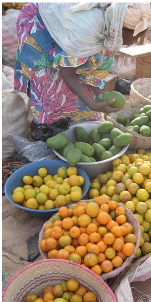
Vente de fruits au Burkina, 2012.

L'objectif de cette contribution est de montrer à travers deux exemples (la maladie et les médicaments) dans les plateaux voltaïques au centre du Burkina Faso, fortement influencés par la culture des moose 13 , comment la mobilisation du concept de genre dans des recherches en anthropologie de la maladie permet une analyse pertinente, performante et opératoire des questions de santé. Elle vise à montrer comment une approche originale des représentations et des pratiques sociales dans le champ sanitaire en référence au concept de genre autorise en retour la production de résultats permettant de mieux comprendre le processus de constructions culturelles des identités féminines et masculines dans une société.