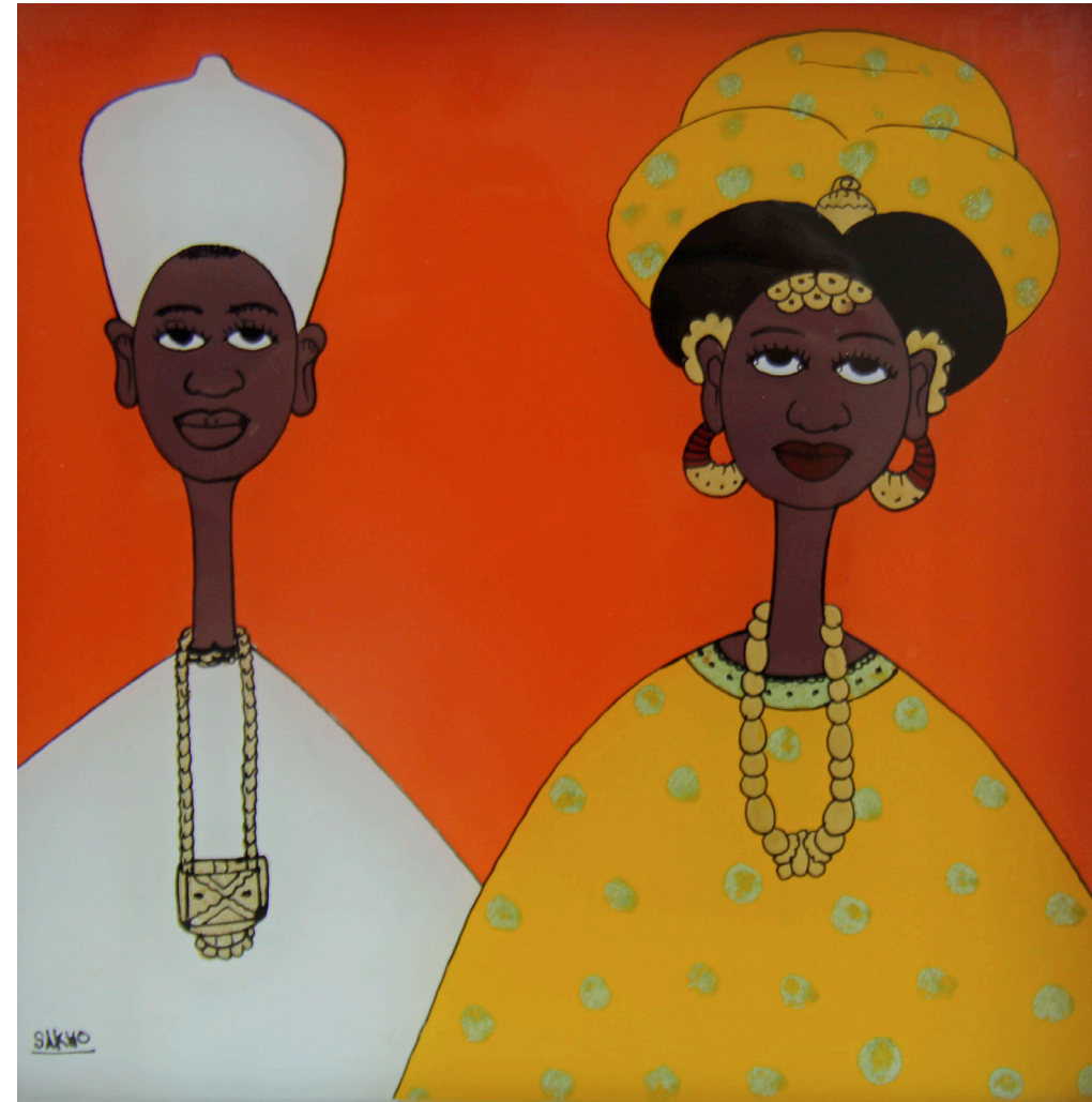
Peinture sous-verre ou «fixé», Sénégal, Sakko.

L'après divorce des femmes reste tributaire de leur âge au divorce, leur niveau d'instruction, le statut d'occupation de l'ex mari, les réseaux familiaux auxquels elles appartiennent. Somme toute, la réorganisation de la vie affective, économique et sociale des femmes divorcées nous fait dire que le divorce offre aux femmes le privilège qui est réservé aux hommes grâce à la polygamie.