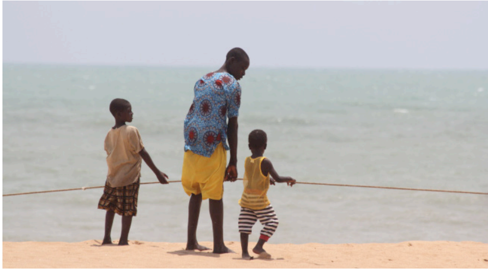
Ouidah, Bénin, 2012. J.P Rolland.

les données recueillies selon le sexe des individus. L'article de Agnès Adjamagbo qui inaugure cet ouvrage explicite clairement ces mécanismes. Cette propension des démographes à envisager l'un et l'autre sexe les a conduit - en ce qui concerne les études en sciences sociales développées sur l'Afrique - à considérer les phénomènes sociaux tant d'un point de vue masculin que féminin. Appelés à être attentifs aux catégories d'âge, de génération et de sexe, les démographes produisent des données concernant chacune de ces catégories et cela dans un but de représentativité. Une telle approche méthodologique, si elle ne suppose pas nécessairement de saisir les multiples modalités des relations entre les sexes dans la société considérée, permet toutefois de mettre à disposition des données indispensables à une approche relationnelle. Pour autant, posséder des données à proportion égale sur les hommes et les femmes en fonction de leur