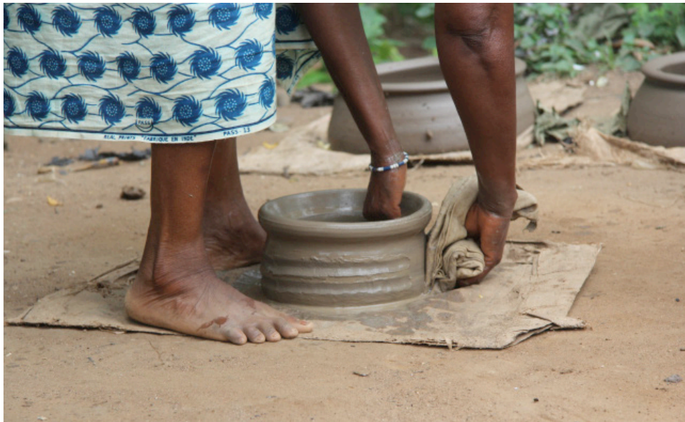
Sé, Bénin, 2013. J.P Rolland.

Ce travail s'appuie sur des enquêtes au long cours menées entre 2008 et 2014 auprès de militants d'associations islamiques. Au fil de ces investigations, le dynamisme des femmes impliquées dans ces associations à travers les cellules féminines s'est donné à voir, m'incitant à creuser la question du militantisme islamique féminin. Les femmes m'ont fait un accueil particulièrement chaleureux, générant une relation d'enquête où la perspective d'exprimer leur conception des rapports de genre semblait les stimuler.