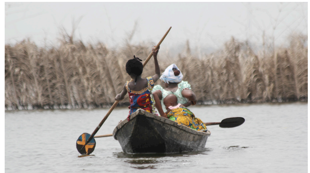
Ganvié, Bénin, 2012.