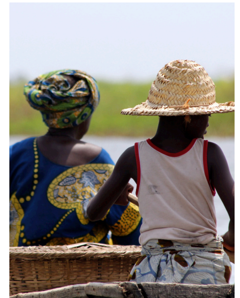
Les Aguégus, Bénin, 2011. J.P Rolland.

La réitération est le mécanisme par lequel l'apprentissage des normes de genre et l'intégration, voire l'incorporation des normes de genre se fait. Agir selon ces normes participe de leur apprentissage comme de leur perpétuation. L'article de Bénédicte Gastineau et de Eve Senan Assogba témoigne de ce processus : en répétant les normes dominantes liées aux pratiques selon le genre, on les intègre. Les observations que ces deux chercheuses ont menées au sein des écoles primaires béninoises autour de la dévolution des tâches et des jeux des filles et des garçons illustrent la puissance performative des actions. En se voyant agir et en agissant eux-mêmes filles et garçons perpétuent des normes de genre. L'école aujourd'hui en Afrique de l'Ouest en accueillant la très grande majorité des enfants d'une même classe d'âge