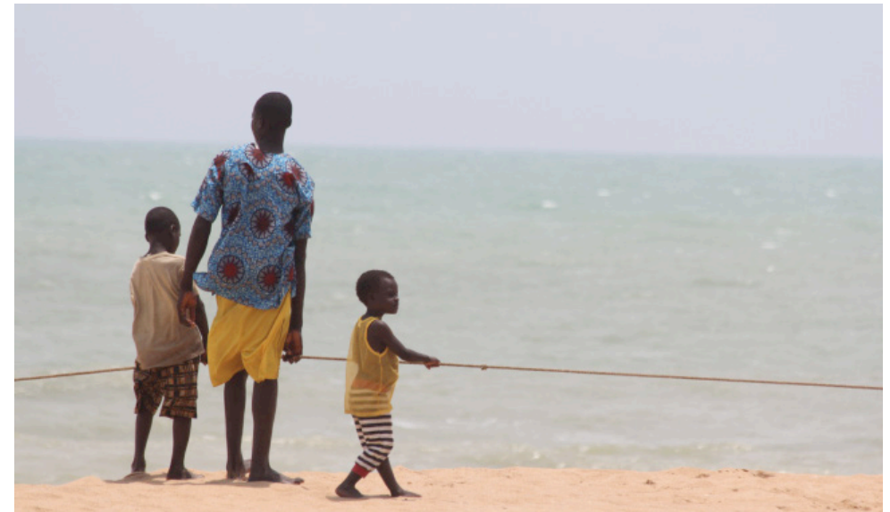
Ouidah, Bénin, 2012. J.P Rolland.

Un balayage de l'ensemble des travaux produits à propos des sociétés ouest africaines cherchant à décrire les univers masculins et féminins, a très clairement mis en avant les capacités stratégiques des femmes qui dans des processus complexes ont pu tirer parti de leur position dominée ou bénéficier d'une véritable autonomie 31 . D'autres auteurs ont montré que la complémentarité des pouvoirs féminins et masculins participait à la régénération du monde symbolique et pratique, ils ont alors défendu dans leurs travaux l'existence de l'effectivité des capacités d'agir de l'un et l'autre sexe (Henry