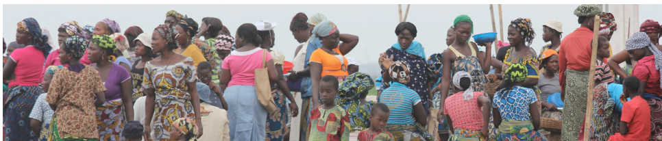
Ganvié, Bénin, 2011. JP. Rolland.

Des mesures ont été prises pour assurer le respect, la dignité et la liberté des élèves et des enseignants(e)s qui ont participé à l'enquête. Durant la formation du personnel de terrain, l'accent a été mis sur la nécessité d'obtenir le consentement éclairé des enseignants(e)s et directeurs, directrices. À cet effet, une charte a été signée par tous les membres de l'équipe et déposée auprès des directeurs et directrices de chaque école. Elle rappelle l'engagement de l'équipe pour le consentement et l'anonymat de l'enquête, principes fondamentaux d'éthique.