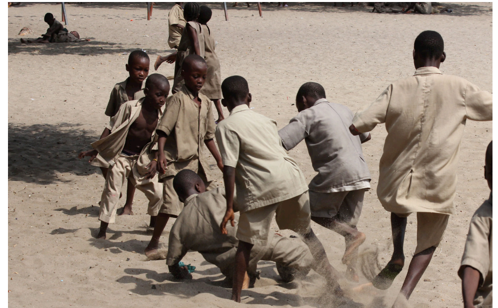
Cotonou, Bénin, 2014. J.P Rolland.

à la construction des rapports sociaux de sexe dans la société béninoise. Nous ne présenterons dans cet article que des résultats qui concernent les moments de récréation, nous ne prétendons pas embrasser tout le sujet 18 . La cour de récréation est un lieu d'observation intéressant : les élèves y expérimentent les règles de la vie en société avec, par rapport aux moments de classe, une présence faible des adultes (Delalande 2003).