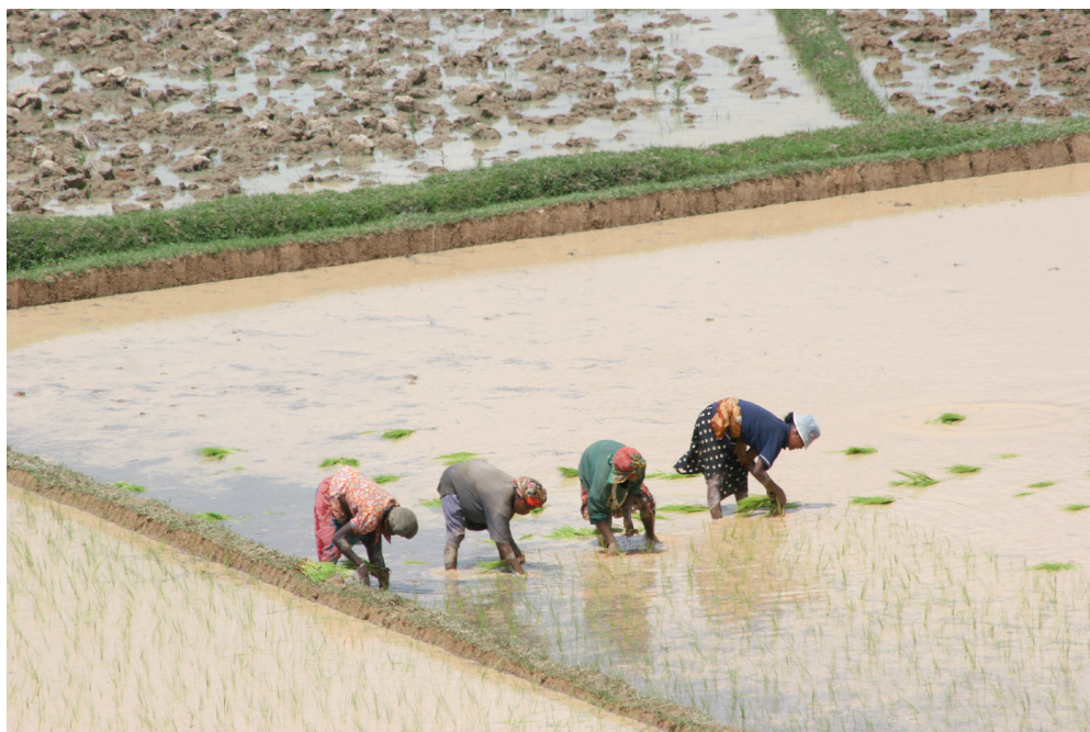
Sahambavy, Madagascar, 2006. J.P Rolland.

Par ailleurs, chercheurs et acteurs n'ont pas toujours la même approche sur le terrain et la même manière d'y appréhender les problèmes.