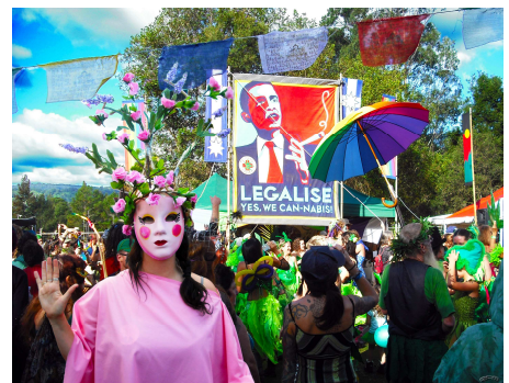
« Legalise » de Mardi Grass (2012) - CC BY 2.0

Pierre Kopp et Miléna Spach s'intéressent ici, en particulier, à un effet de l'interdiction qui, bien qu'intuitif, n'est pas souvent considéré : l'interdiction ne serait-elle pas en elle-même un facteur d'attractivité pour les jeunes ?