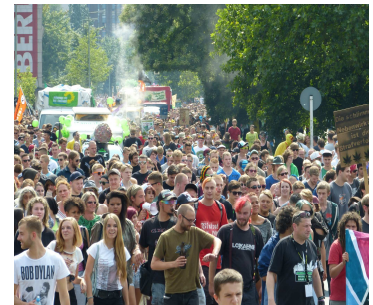
« Hanfparade 2013 Berlin »

Cet attrait pour l'interdit peut aussi être compris par l'« utilité identitaire » que revêtirait la consommation de drogue pour certains. Akerlof et Kranton 4 ont, au croisement de la sociologie, de l'anthropologie et de la psychologie, identifié certaines sphères, comme l'école, où chaque individu appartient à un groupe bien défini, et où il est très coûteux de changer de groupe. Chacun a alors intérêt à s'ancrer dans son propre groupe en adoptant les attitudes. La consommation de drogue peut être constitutive de l'identité d'un groupe.