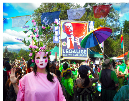
« Legalise » de Mardi Grass (2012) - CC BY 2.0

Pierre Kopp et Miléna Spach s'intéressent ici, en particulier, à un effet de l'interdiction qui, bien qu'intuitif, n'est pas souvent considéré : l'interdiction ne serait-elle pas en elle-même un facteur d'attractivité pour les jeunes ?