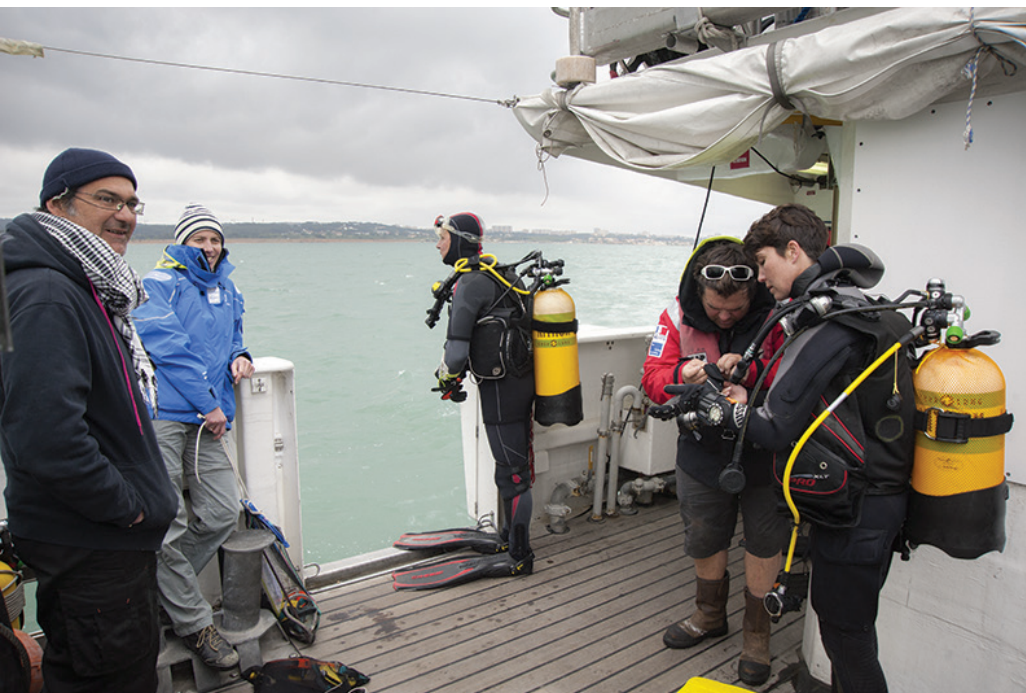
Figure 1 : À bord de l'André Malraux, navire du Drassm, derniers préparatifs de deux plongeurs avant l'immersion dans les eaux du Golfe du Fos.

des sites archéologiques étudiés se situe en milieu immergé, les plongeurs participant à cet axe, qu'ils soient archéologues, architectes, photographes, topographes, etc., sont tous titulaires d'un certificat d'aptitude à l'hypébarie 2 . Équipés d'un scaphandre autonome (Figure 1), ils peuvent alors exercer leur métier et mettre en œuvre leurs compétences dans les eaux des espaces maritimes, fluviaux et lacustres.