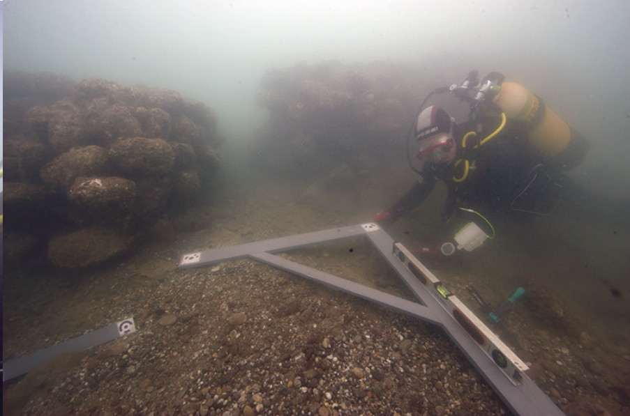
Figure 3 : Levé topographique préparatoire au relevé par photogrammétrie rapprochée des structures architecturales de l'Anse de Saint-Gervais, chantier-école de Fos-sur-Mer.

tion virtuelle de la géométrie et des textures des objets de la scène, d'élaborer une grande variété de représentations et de documents : sections, courbes de niveaux, orthoimages 9 , maillages texturés, calcul des volumes, etc. (Figure 5). Tous ces produits, issus du levé par photogrammétrie rapprochée, permettent de mieux comprendre et appréhender l'objet étudié tout en facilitant l'établissement des représentations normalisées telles qu'elles sont définies par les conventions du dessin géométral : plans, coupes, élévations, etc.