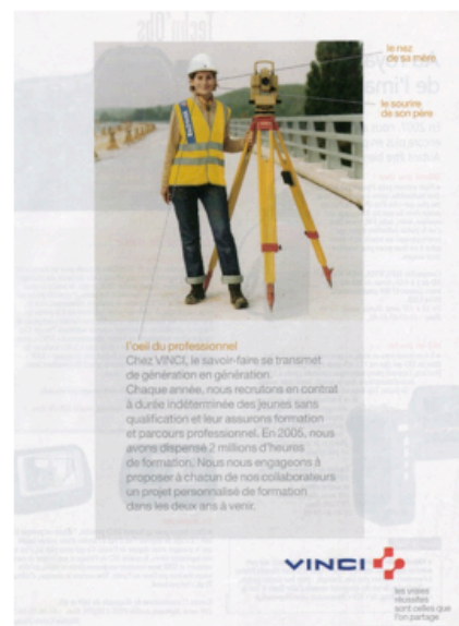
Illustrations 4 à 7. Campagne presse du groupe Vinci (2007).