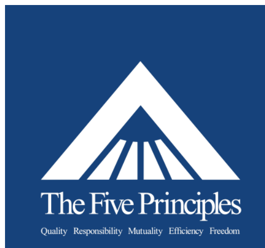
Illustration 3. Les cinq principes de Mars (logo).

En première approximation, il semble que, chez Mars, cette fiction normative soit transmise via la communication : le langage (écrit, oral, gestuel) et les structures de l'entreprise (organigramme, architecture, etc.). Mars promet un avenir meilleur à ses employés (littéralement, dans le livret liminaire), en échange de quoi leurs destins sont liés (« En tant qu'associés, on endosse la responsabilité de tous »). Chacun doit travailler à la réussite de l'entreprise, chacun dépend des autres, ce qui justifie le contrôle de tous – et la cohésion dans le secret des affaires, dans la discrétion familiale. Les proclamations du credo interne sont là pour le rappeler, figurées par un symbole éloquent tant il reprend une double symbolique mystique et hiérarchique (illustration 3).