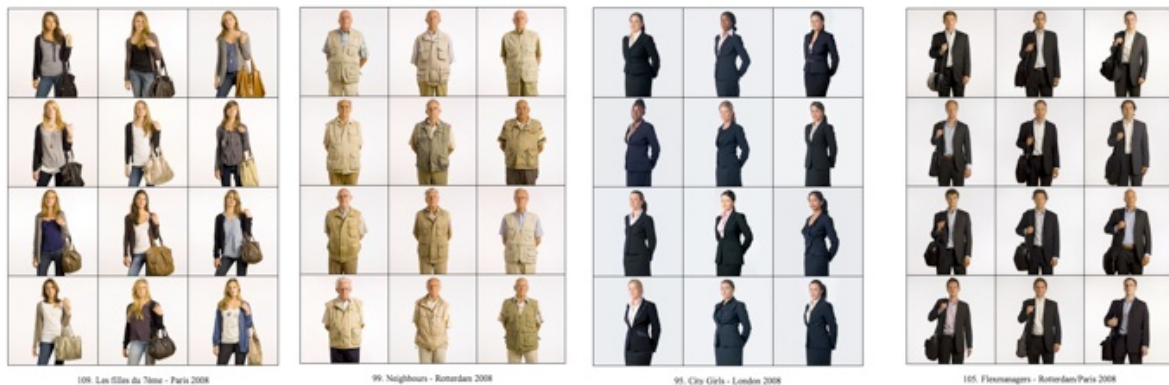
Illustrations 8 à 11. Exactitudes.

personnes sont compétentes, généreuses, impliquées dans leur travail et atteste ces vertus par le couplage entre la photographie et l'épisode narratif qui lui succède, selon un agencement caractéristique de la figuration au Moyen Âge. Et ces publicités remplissent l'office des reliques : figurer les gestes des saints pour en conserver la mémoire certes, mais surtout pour en dispenser l'enseignement, en assurer la transmission (Schmitt, 2002).