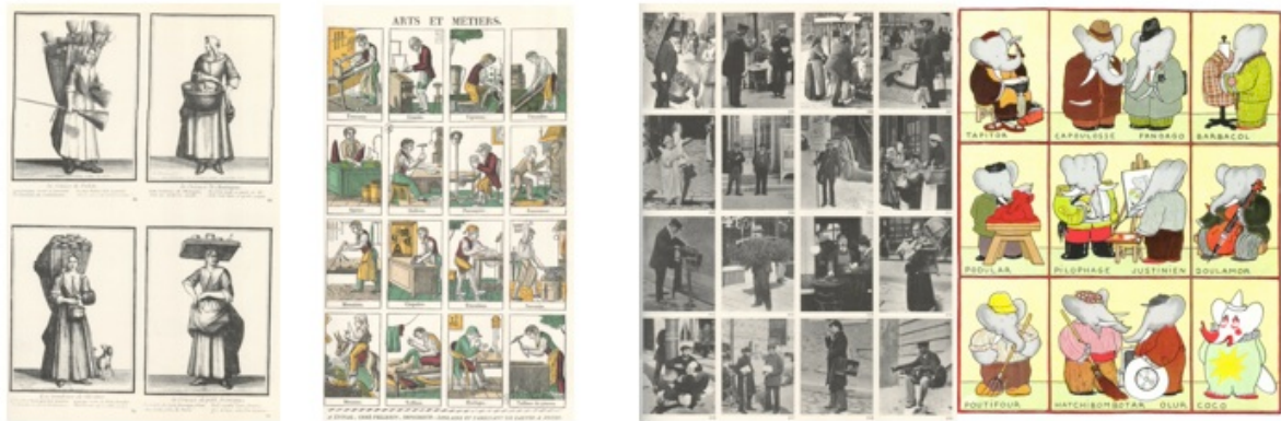
Illustrations 12 à 15. Les petits métiers.

photographie (chez Eugène Atget ou Jérôme Doucet, illustration 14, 1901) ou le cinéma (Alain Cavalier 14 ), en passant par la littérature enfantine (illustration 15, 1933), celle-là même que lisait sans doute le jeune Porter avant d’emmurer les secteurs dans une case (trop) hermétique (Porter, 1980), offrant à son modèle d’analyse stratégique à la fois l’élément central de sa lisibilité et sa plus grande fragilité conceptuelle.