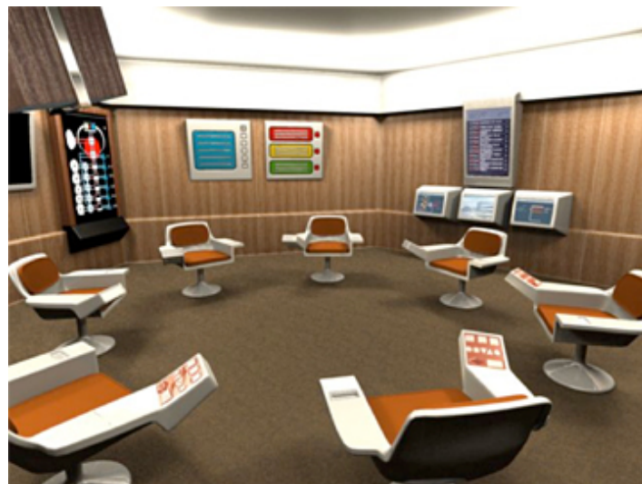
Illustration 1 : La salle de contrôle du projet Cybersyn (« Opsroom » pour operations room) (Medina, 2011)

Rencontrant les techniques de ses ambitions, la logistique peut enfin quitter la place annexe à laquelle elle a longtemps été contingente dans l'enseignement, la recherche, la vie professionnelle. Chaque pan de la gestion peut s'y adosser, elle devient le squelette qui unit et donne forme. Création de sanctuaires par des duopoles concertés, personnalisation des produits et des services, déploiement de stratégies de préemption ou de prolifération, tarifs d'assurances individualisés en fonction des trajets parcourus, optimisation fiscale par les multinationales, autant d'approches qui reposent sur un étau logistique robuste. Et, peu à peu, parce que les pratiques de consommation changent et que les outils se miniaturisent et gagnent en fiabilité, la logistique n'a plus simplement en charge l'administration des choses – des stocks et des flux d'objets et de produits, de matières et de marchandises – mais celle des personnes. L'individu, ses déplacements, ses consommations, ses besoins, est pris dans le flux, suivi, géré. Au-delà de leurs différences, la logistique hospitalière et la gestion des files d'attente par les opérateurs des parcs de loisirs procèdent d'un même mouvement de contagion de la pensée logistique à l'ensemble des espaces qui ressortissent du champ de la