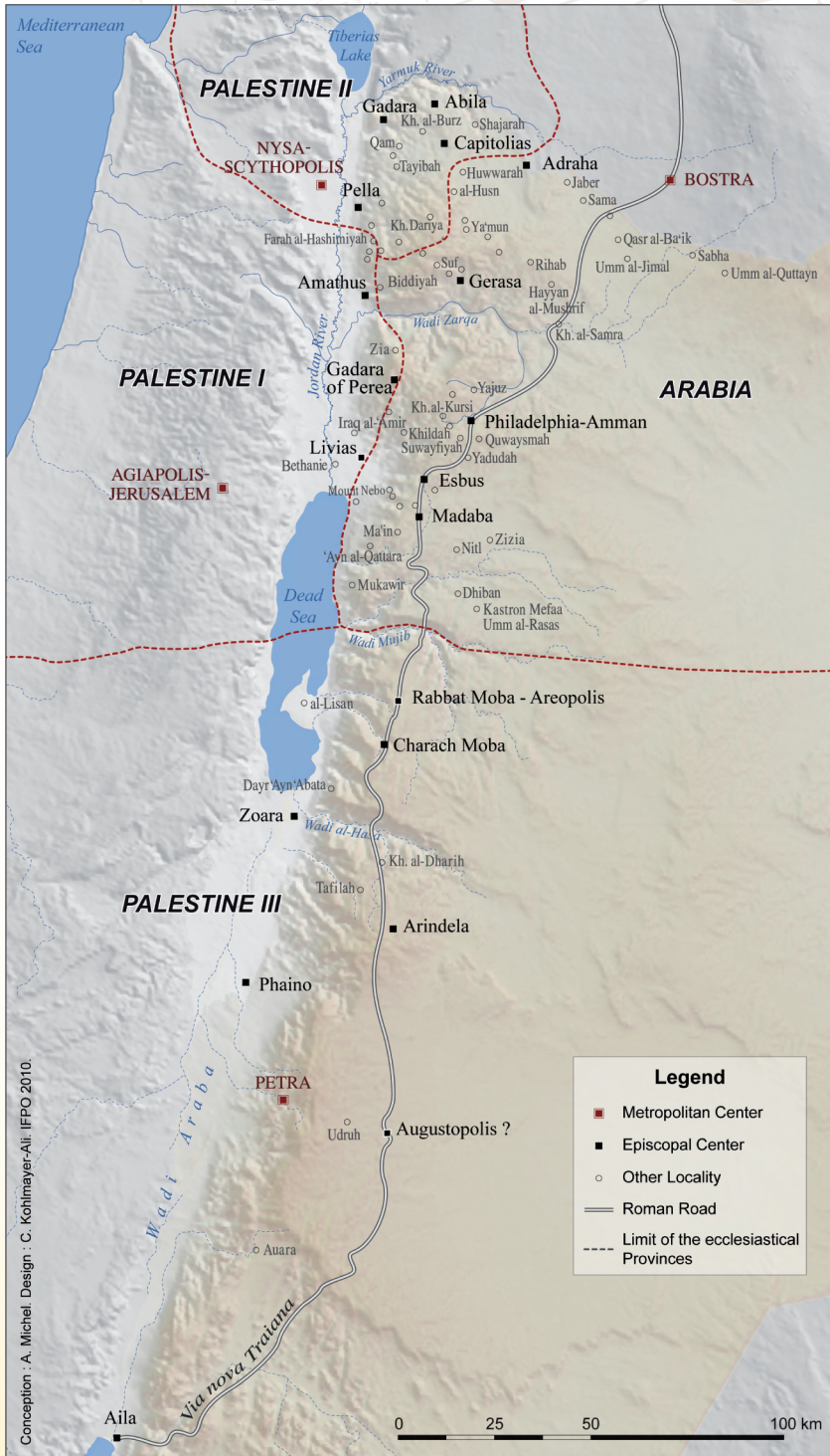
Jordan under the Byzantines

The Church of Lions at Umm al-Rasas is representative of the 6th century churches in the provinces of Arabia and Palestine. There is a large rectangular hall divided into three naves by a series of pillars which support arcades (shown here on the ground to the left of the image) and which end with one or several apses. The floor is often decorated with mosaic depicting geometric patterns, hunting scenes, seascapes or pastoral scenes.