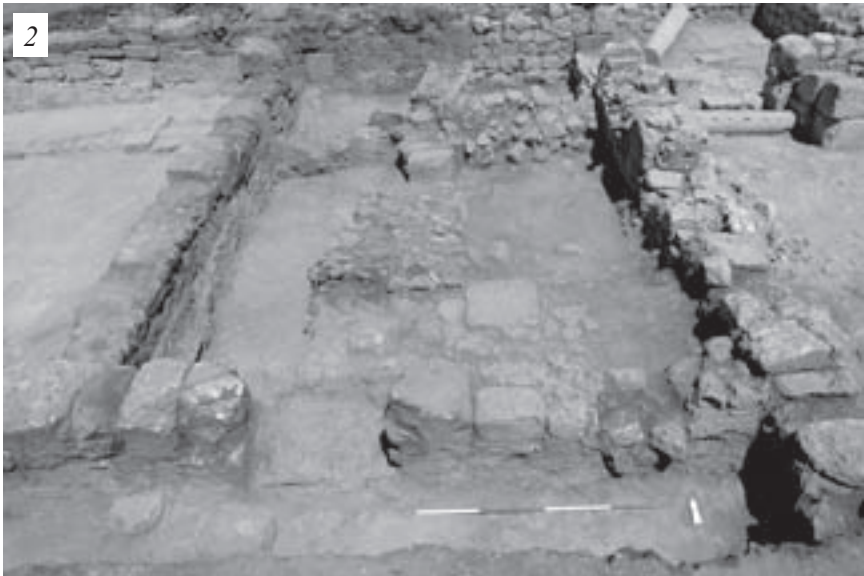
Pl. XVI, 1 — Secteur E II : angle Sud-Ouest – bâtiment du début de l'époque islamique.