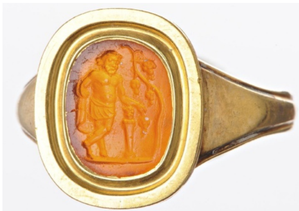
Figure 4 : Silène accoudé à un pilier hermaïque. Cornaline. 10,5 x 8 mm. I er siècle av. J.-C.

elle-même sert-elle de support (comme le ferait un pilier) ? Le cas échéant, convoquer la mythologie gréco-romaine peut venir dissiper les zones d'ombre qui persistent. Néanmoins, il n'est pas rare que plusieurs critères viennent cohabiter ; à titre d'exemple, le Palladion peut venir couronner une colonne, un pilier hermaïque peut servir de support [fig. 4]. In fine , la combinaison de procédés figuratifs au sein d'une même gemme permet de définir de manière assurée une figure comme étant une statue.