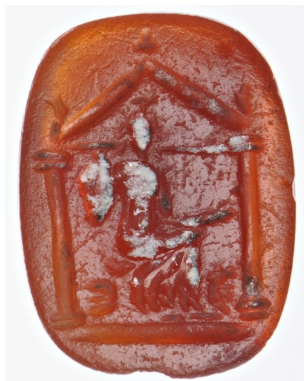
Figure 3 : Cybèle assise dans un temple. Cornaline. 13 x 9 x 2 mm. II e siècle ap. J.-C.

Les critères que nous venons d'exposer ont été classés en fonction de leur degré de fiabilité. En effet, parfois, la présence d'un seul critère peut s'avérer insuffisant pour identifier une figure comme étant une statue : le doute peut subsister. Nous songeons ici tout particulièrement aux cas où la figure est installée sur un support. Des questions subsidiaires devront alors être posées : la figure est-elle plus petite que les autres personnages ? Emprunte-t-elle une allure roide, hiératique, qui contraste avec celle des autres personnages ? On pourra aussi interroger la fonction endossée par la figure : la figure côtoie-t-elle des personnes s'affairant autour d'elle avec des offrandes (auquel cas, il est hautement probable qu'il s'agisse d'une statue de culte) ? La figure