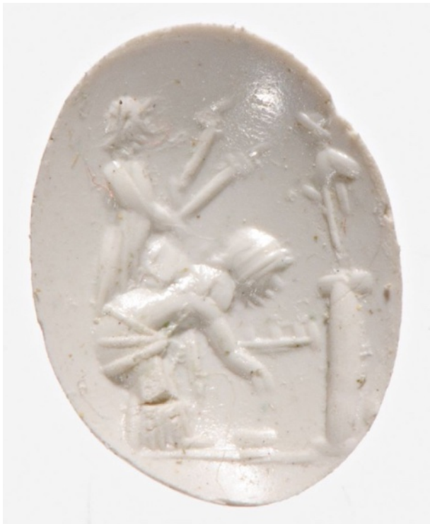
Figure 10 : Femmes faisant une offrande. Sur une petite colonne, une statuette de Priape. Empreinte moderne d'une améthyste. 11 x 8,5 x 4 mm. I er siècle ap. J.-C.

très caractéristique, a une fonction : mettre en évidence l'attribut du dieu, son « arme », son membre rougeoyant. De fait, la simple attitude qui consiste à montrer cette torsion du dos violemment rejeté en arrière permet à elle seule d'identifier le dieu. La spécificité « ithyphallique », à défaut d'être représentée, est clairement sous-entendue, quand bien même nous aurions affaire à une forme minimaliste.