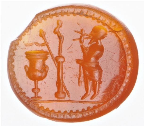
Figure 12 : Homme jouant de l'aulos.

De même, sur certaines fresques romaines accueillant des paysages sacro-idylliques, la statuette de Priape était associée à un arbre, ce dernier étant situé juste derrière elle 14 . Pour Jacqueline Fabre-Serris, l'arbre renvoie, à lui seul, à la nature sauvage. L'arbre juxtaposé à une construction sacrée met en scène, selon elle, « une coexistence épurée entre une image symbolique des bois, qui jadis furent « habités aussi par les dieux », et des traces de cette présence divine sous la forme de monuments culturels qui furent dressés par les hommes » 15 . On voit que les pigments employés pour représenter l'effigie priapique empruntent au brun-rouge, voire au marron. Dans ses travaux sur la peinture murale, Eric M. Moormann a montré que les pigments étaient choisis au préalable par l'artisan en fonction du matériau qu'il voulait imiter 16 . Ici, il ne