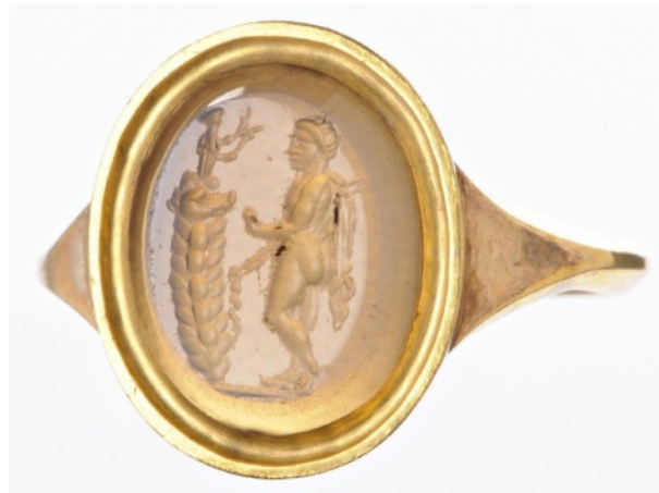
Figure 6 : Méléagre face à une statuette de Diane disposée sur un rocher. Nicolo. 12 x 9,5 x 3 mm. I er siècle ap. J.-C.