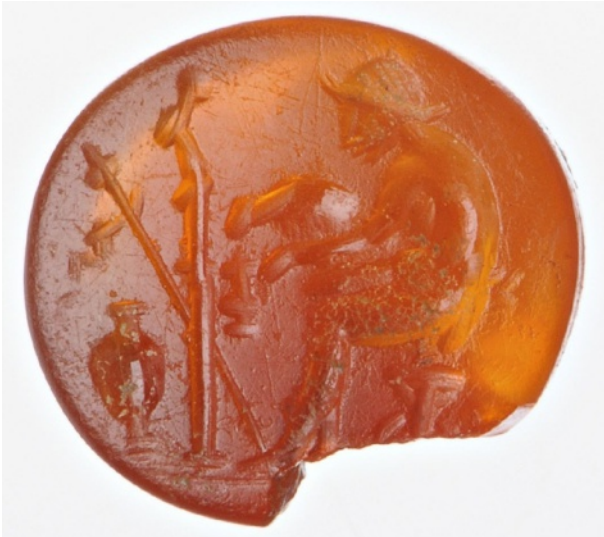
Figure 14 : Satyre assis en face d'une effigie de Priape surmontant une petite colonne. Cornaline. 9 x 8,5 x 4 mm. Seconde moitié du I er siècle av. J.-C.

murale ne laisse guère de place aux tergiversations, la glyptique ne permet malheureusement pas de trancher. La taille grossière du dessin, parfois proche du croquis, pourrait toutefois évoquer ces petites effigies taillées à la hâte par le paysan ; songeons ici au profil « anguleux » de la Lordosis. En outre, la statue paraît parfois se confondre avec les branches de l'arbre [fig. 9].