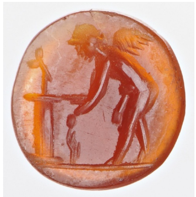
Figure 11 : Éros faisant une offrande. Sur une petite colonne, une statuette de Priape. Cornaline. 9 x 9 x 2 mm. Fin du I er siècle av. J.-C. – milieu ou troisième quart du I er siècle ap. J.-C.

On peut remarquer quelques occurrences où le type de la « Lordosis » est dépourvu de phallus [fig. 9, 12 et 14], néanmoins l'effigie du dieu demeure reconnaissable. En effet, cette posture,