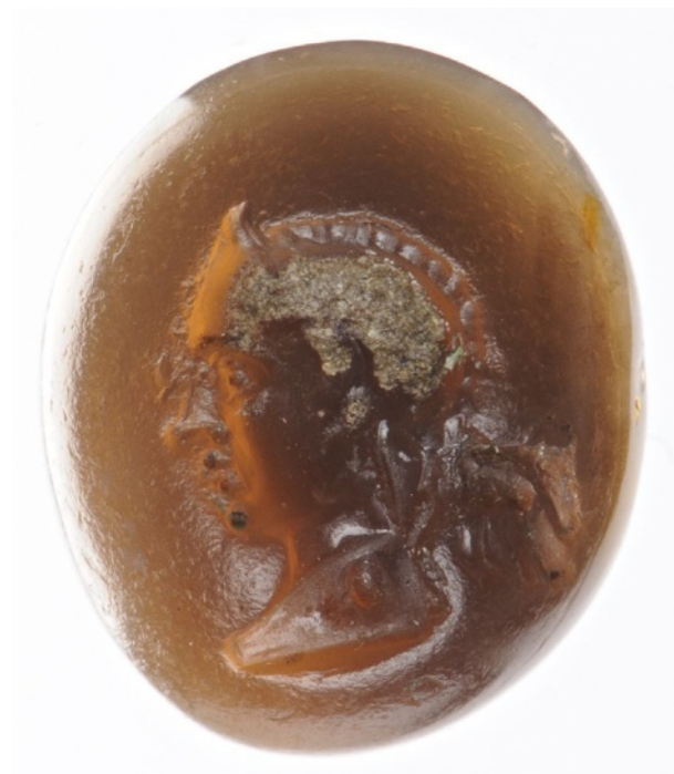
Figure 2 : Pilier hermaïque à l'effigie d'Éros. Sardoine. 14 x 12 x 5 mm. II e – I er siècle av. J.-C.

Les critères que nous venons d'exposer ont été classés en fonction de leur degré de fiabilité. En effet, parfois, la présence d'un seul critère peut s'avérer insuffisant pour identifier une figure comme étant une statue : le doute peut subsister. Nous songeons ici tout particulièrement aux cas où la figure est installée sur un support. Des questions subsidiaires devront alors être posées : la figure est-elle plus petite que les autres personnages ? Emprunte-t-elle une allure roide, hiératique, qui contraste avec celle des autres personnages ? On pourra aussi interroger la fonction endossée par la figure : la figure côtoie-t-elle des personnes s'affairant autour d'elle avec des offrandes (auquel cas, il est hautement probable qu'il s'agisse d'une statue de culte) ? La figure