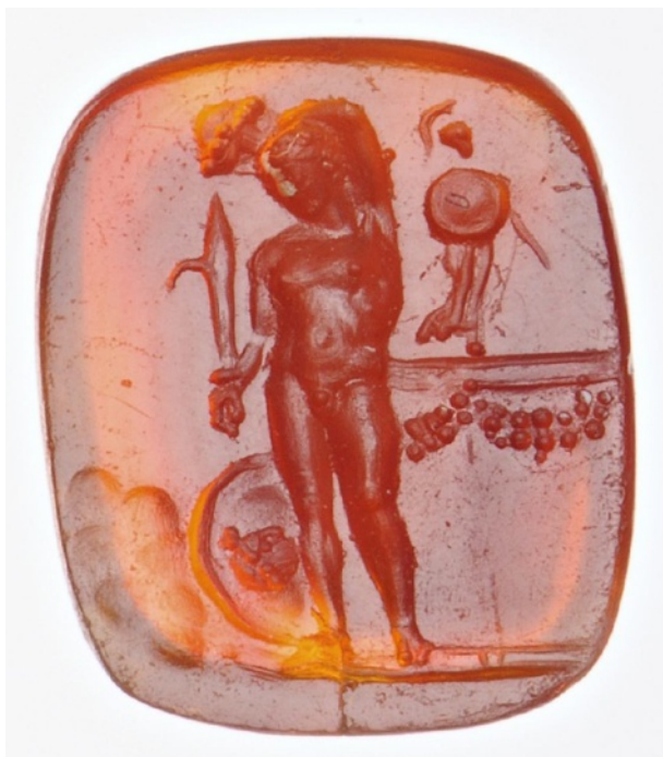
Figure 5 : Persée regardant le reflet de la tête de Méduse sur un bouclier. Sur l'autel, une effigie d'Athéna. Cornaline. 10,5 x 9,5 x 2,5 mm. II e - I er siècle av. J.-C.