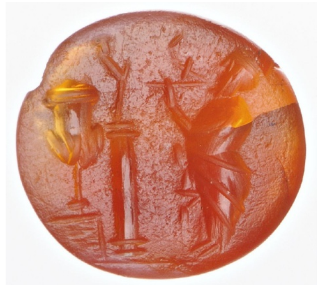
Figure 13 : Homme jouant de l'aulos.