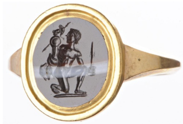
Figure 7 : Diomède dérobant le Palladion. Agate. 11 x 10 mm. II e siècle av. J.-C.

Les supports qui accueillent une figure statuifiée sont de diverses sortes : cela peut être une colonne ou un piédestal, un socle bas circulaire, un autel orné de guirlandes [fig. 5], un tas de pierres [fig. 6], une main [fig. 7]. Dans ces cas-là, la figure est de taille moindre que les personnages qui peuplent la scène. Quant aux structures architectoniques qui abritent la statue, il peut s'agir d'un édicule ou d'une niche disposée sur un petit monticule rocheux, voire même d'un temple [fig. 3]. Le temple peut présenter un fronton triangulaire supporté par deux ou quatre colonnes suivant les gemmes. La forme du temple peut parfois s'apparenter à celle d'une tholos.