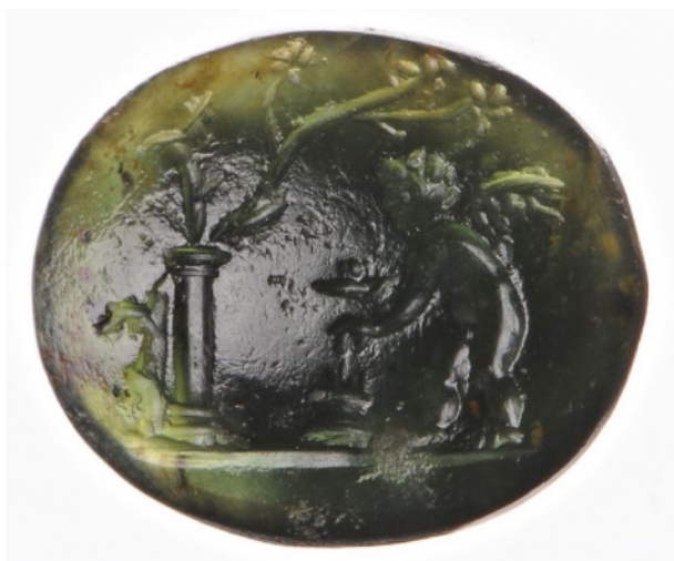
Figure 8 : Éros faisant une offrande.

Dans notre corpus glyptique, l'état statufié de la divinité est indiqué par sa mise en scène dans la composition. Le dieu est souvent montré trônant en station debout sur un support. Tantôt il est disposé au sommet d'une colonne, tantôt il est figuré sur ce qui semble être un tas de pierres. En de rares occasions, il est montré reposant à même la ligne de sol. Parfois encore, Priape est abrité dans une petite niche ou un édicule, à la manière des effigies des Lares.