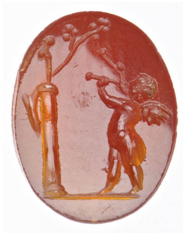
Figure 9 : Éros jouant de l'aulos.

Quand on s'intéresse aux diverses représentations du dieu que nous offrent à voir les témoignages artistiques dans leur globalité, on constate que la typologie varie. Si l'on se réfère au Lexicon Iconographicum Mythologiae Classicae , le dieu est représenté essentiellement selon quatre types 12 . Le type dit « Anasyrma » montre Priape levant le vêtement (soit un chiton , soit un manteau) de manière à exhiber son membre ; le pan du vêtement ainsi relevé est habituellement rempli de fruits. Le type dit « normal » le présente figuré