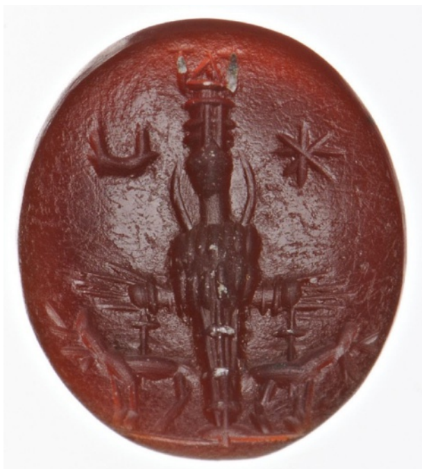
Figure 1 : Artémis d'Éphèse, accompagnée de deux cervidés, le croissant et l'étoile dans le champ. Cornaline. 13 x 10 x 3 mm. II e siècle ap. J.-C.

En résumé, afin de déterminer si ladite figure est ou n'est pas une statue, il est nécessaire d'examiner trois facteurs : sa morphologie, sa localisation et sa fonction.