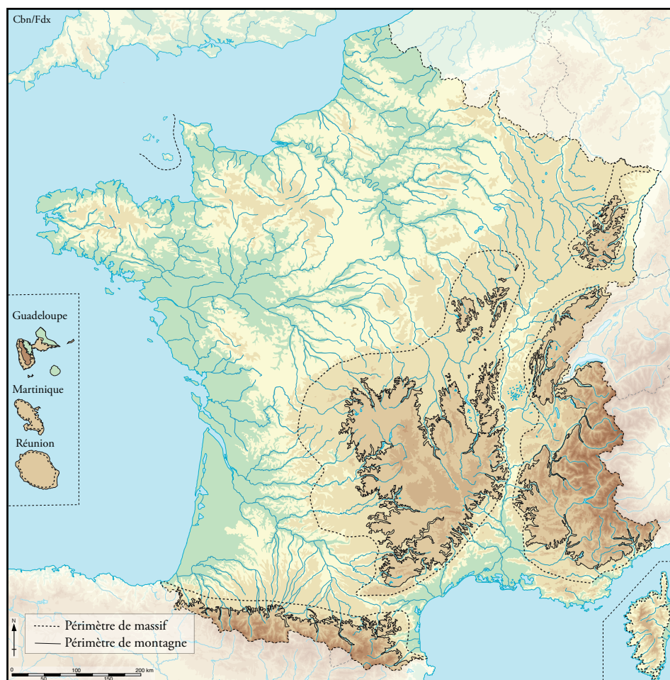
Les territoires de montagne au sens du CGET – 2014 43

Quoi qu'il en soit, dans cet ouvrage, c'est en général la notion de montagne au sens large du terme qui sera retenue, c'est-à-dire la représentation géographique ou intuitive que s'en font les individus et non pas uniquement la zone de montagne au sens juridique du classement évoqué ci-avant. En effet, la délimitation de la notion de montagne prend sens lorsqu'il s'agit de découvrir le régime juridique applicable. Toutefois, si l'exercice classique de qualification juridique s'impose lorsqu'il s'agit d'appliquer des règles d'urbanisme particulières, son intérêt est plus modeste lorsque l'on s'intéresse à la question de la responsabilité : qu'il s'agisse de la responsabilité administrative, civile ou pénale, la notion de montagne importe moins car les règles de responsabilité applicables n'en dépendent pas.