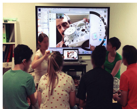
FIGURE 4 – Des élèves interviewant le Professeur F. Mondada.

Lors de cet atelier, les participant·e·s essayeront une des