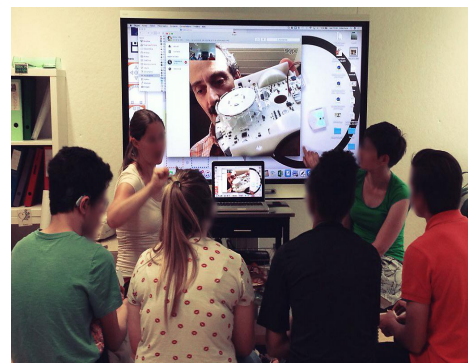
FIGURE 4 – Des élèves interviewant le Professeur F. Mondada.

Thool, ou “Thymio in school” 6 , est un projet qui a commencé en mai 2014 et sera terminé en mai 2018. Il propose aux enseignants de tous les niveaux de classe des activités avec Thymio dans le but d'aborder différents sujets du programme scolaire: des connaissances générales jusqu'à la science physique et la science informatique. Ces activités sont basées sur des projets universitaires en robotique; c'est pourquoi chacune d'elle peut être accompagnée en classe par le visionnage d'une vidéo sur le projet de base et par l'interview d'un chercheur par les élèves eux-mêmes. C'est ainsi que nous pensons favoriser la divulgation de la culture du numérique.