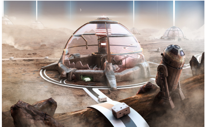
FIGURE 5 – Station Thymio dans le projet R2T2

Avec R2T2, l'EPFL et le NCCR Robotics réunissent des élèves de toute la planète qui collaborent ensemble afin de résoudre une tâche complexe : réparer une base martienne. L'histoire les plonge dans la situation suivante : année 2032, la station martienne est battue par des météorites. Son générateur d'énergie ne fonctionne plus, 16 robots Thymio sont là pour le redémarrer. Pour commander un Thymio il faut 4 ingénieurs au moins. Il n'y a que 3 heures pendant lesquelles les groupes d'ingénieurs du monde entier doivent programmer les robots en coordonnant chacun de leurs pas. Les signaux des commandes passent bien mais la vidéo depuis Mars a un retard de 30 minutes.