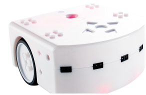
FIGURE 1 – Thymio

VPL est un langage de programmation visuelle qui permet d'aborder des concepts informatiques sans avoir recours à un langage de programmation textuel. Une fois ces concepts étudiés, il est possible de passer à d'autres langages tels que "Scratch" ou "Blockly" et d'arriver finalement au langage textuel "Aseba".