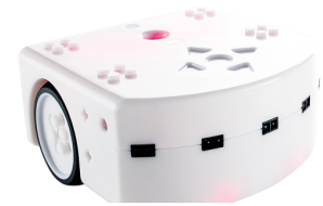
FIGURE 1 – Thymio

VPL est un langage de programmation visuelle qui permet d'aborder des concepts informatiques sans avoir recours à un langage de programmation textuel. Une fois ces concepts étudiés, il est possible de passer à d'autres langages tels que "Scratch" ou "Blockly" et d'arriver finalement au langage textuel "Aseba".