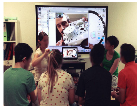
FIGURE 4 – Des élèves interviewant le Professeur F. Mondada.

Lors de cet atelier, les participant·e·s essayeront une des