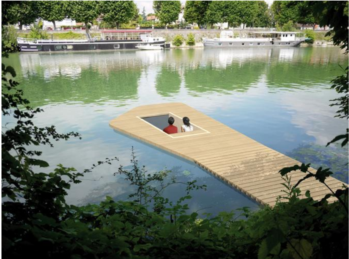
Figure 5 : Contemplation sur l'eau