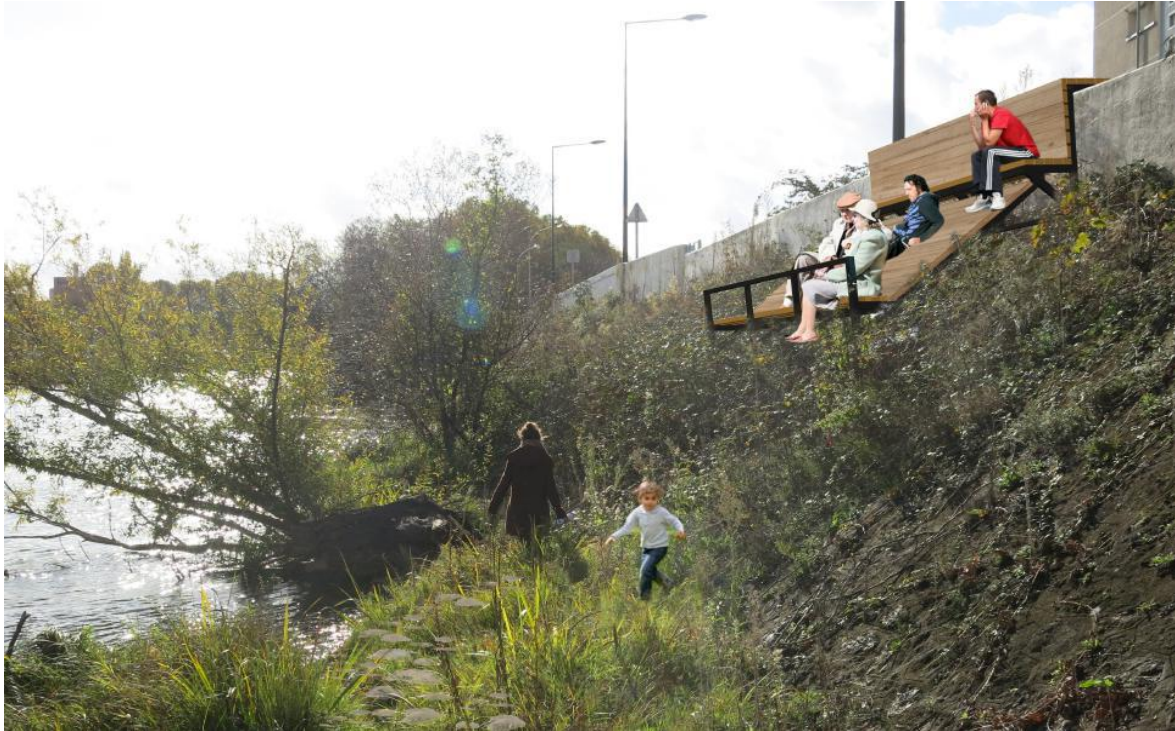
Figure 4 : Renaturation et banc d'observation