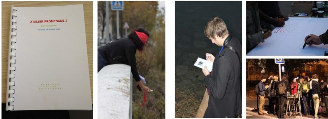
Figure 3 : Atelier promenade à L'Île-Saint-Denis, 2014