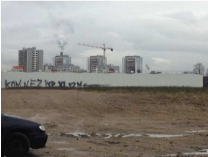
« Les tours qui fument », L'Île Saint-Denis, 2015.

Dès lors, les franges intra-urbaines sont à la fois le lieu d'expériences plus distanciées, plus libres, plus intérieures que les espaces urbains constitués et un révélateur de paysages de la métropole. Elles permettent d'être parmi les lieux des agglomérations et d'en éprouver les paysages.