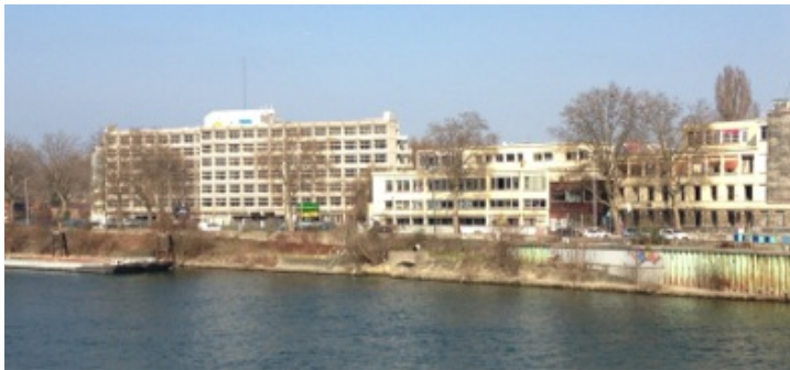
Le 6 B, îlot en friche composé d'un ancien immeuble de bureau et de ses espaces extérieurs entre la Seine et le canal Saint-Denis, Saint-Denis, 2013.

De fait, elles ne constituent pas un « nulle part ». Elles sont toujours valorisées quand elles sont accessibles à partir de la ville constituée et habitée. Ainsi, un délaissé non accessible et non visible, par exemple derrière des palissades, est considéré comme un espace confisqué, voire une coupure. Il peut toutefois retrouver un statut de frange s'il est à nouveau ouvert. Par exemple, la reconquête d'un bâtiment à l'abandon et de ses espaces extérieurs en 2010 par un collectif d'architectes, le 6B, a permis de donner à voir et d'ouvrir cette partie de la friche Alstom en attente d'un projet de réaménagement. Jusqu'alors cachée derrière les voies ferrées et des palissades, cette friche apparaissait comme un no man's land et non comme un délaissé ouvert sur la Seine et la ville de Saint-Denis. Elle est à présent perçue comme accessible par les usagers, plus encore lors des portes ouvertes du 6B et de la manifestation artistique La Fabrique à rêves qui proposent des animations autour d'aménagements extérieurs temporaires tous les étés.