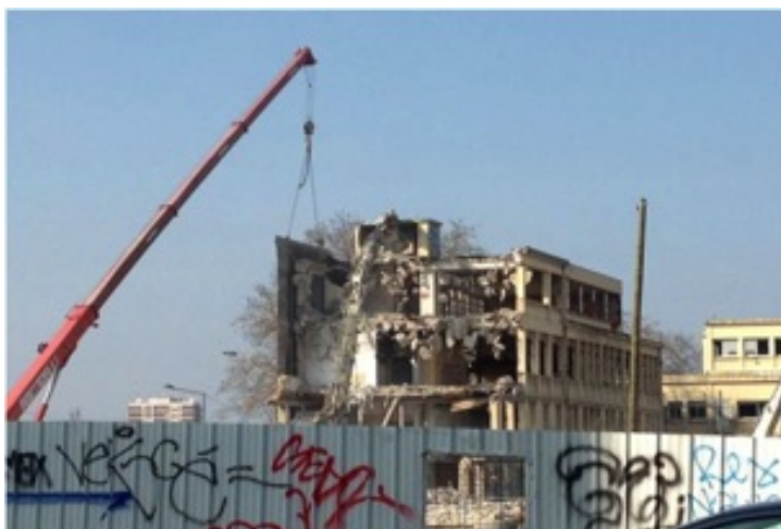
Paysage en mutation exprimant le mouvement urbain, Saint-Denis, 2014.

émerge le tout, l'univers commun des hommes. Les franges semble ainsi représenter une pause, une respiration, qui rend possible l'appréhension du monde et de ses paysages. Conjugué à la sensation de soi, il fait apparaître en miroir le monde et ses multiples paysages en présence, qu'ils soient urbains ou naturels, sociétaux ou personnels.