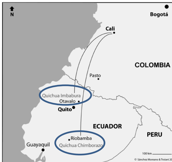
Carte n°1 Départements d'origine des Quichuas en Equateur. (Sanchez Moreano 2017, 149)