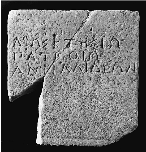
Εικόνα 2. Rolley 1965, no. 2.

θεοί είναι εκείνοι των οποίων η λατρεία μεταφέρεται από γενιά σε γενιά μεταξύ των μελών μιας ομάδας και των οποίων η φύση μπορεί να ποικίλει από τη μία πόλη στην άλλη (φατρίες, φυλές και πατριές). Προφανώς λοιπόν, η επίκληση βρίσκεται στο σημείο που διασταυρώνονται τρεις σφαίρες: η σφαίρα του ατόμου, η σφαίρα της ομάδας πολιτών στην οποία ανήκει αυτό το άτομο, και τέλος η σφαίρα της πόλης στο σύνολό της.