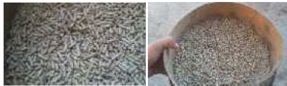
Figure 2. Tamisage du granulé avant sa distribution aux lapins

L'aliment commercial utilisé est un granulé fabriqué et commercialisé par la SARL "Production locale" sise à Bouzareah à Alger. Il a été tamisé avant sa distribution afin de le débarrasser des miettes et poussières provenant de granulés qui se sont effrités (figure 2).