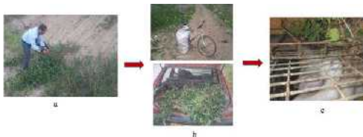
Figure 3. Récolte (a), Transport (b) et distribution(c) du Sulla en vert

Le Sulla ( Hedysarum flexuosum ) en vert a été fauché quotidiennement, manuellement, acheminé au clapier, laissé se déshydrater durant 24 h à cause de son taux d'humidité très élevé à la fauche (Kadi et al 2012a) et ensuite distribué aux lapins à volonté sur cage (figure 3).