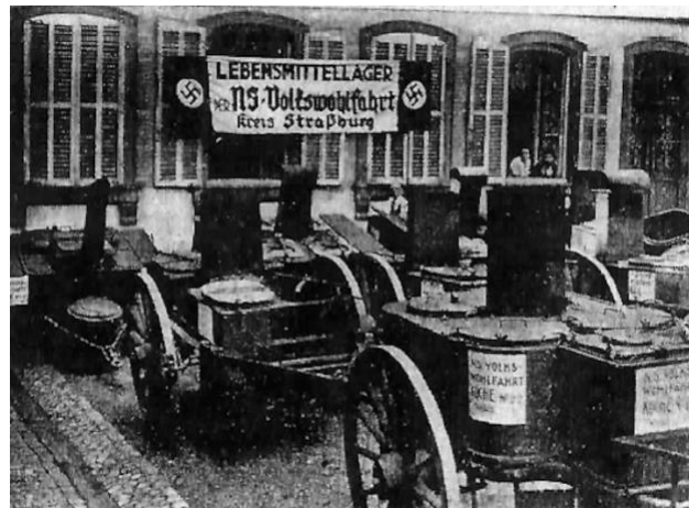
Figure 3: Photographie illustrant l'aide de la NSV aux évacués de Strasbourg 29 .

Conjointement à cette propagande anti-française, l'évacuation sert aussi de faire-valoir aux Allemands qui tentent de convaincre les évacués de leur dévouement. Pour cela ils exercent alors une « propagande par l'action » ( Propaganda der Tat ) qui se manifeste sous la forme de distributions de soupe par la Nationalsozialistische Volkswohlfahrt (NSV), fortement relayée dans les journaux régionaux (fig. 3).