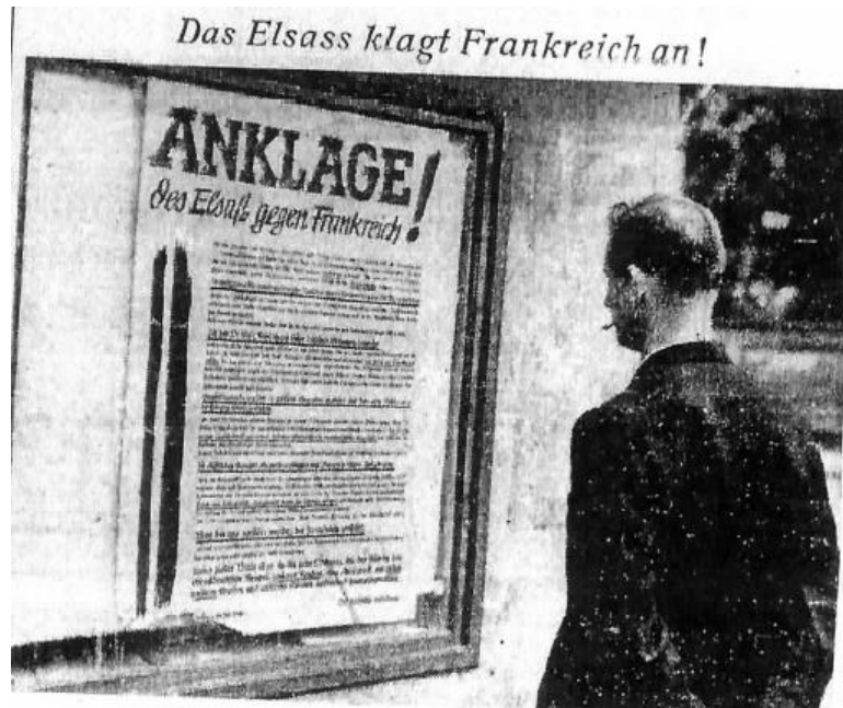
Figure 2 : Propagande anti-française en Alsace par le biais d'affiches 28 .

Maude Williams, Guerre de mots et d'images : Propagande, communication et rumeurs lors des évacuations de la région frontalière (1939/40)