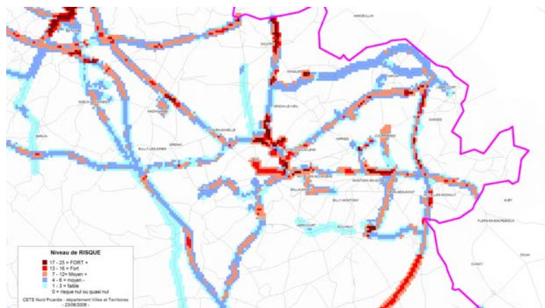
Illustration 4: Exemple risque TMD routier (conception: F. Hasiak - CETE NP)

qualitatif (6 niveaux). A titre d'exemple, un aléa TRES FORT croisé avec une vulnérabilité TRES FORT conduit à un risque TRES FORT.