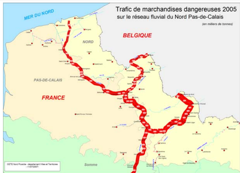
Illustration 2: Trafic MD sur le réseau fluvial du NPDC - tonnes 2005 (conception: F. Hasiak - CETE NP)

Parmi les produits dangereux transportés par voie fluviale, les matières combustibles (classe danger 5.1) et les liquides inflammables (classe de danger 3) sont les plus nombreux, ces deux types de produits représentant respectivement 53% et 37%. Seule une dizaine de quais génère 80% des flux TMD. L'essentiel du trafic MD (2005) se trouve sur le canal à grand gabarit.