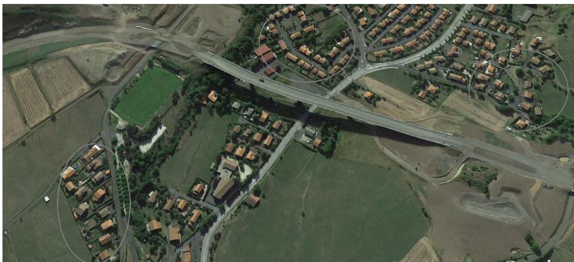
Figure 4 : Site de Taulhac

avec la construction d'un viaduc qui a duré 2 ans, ils ont ensuite redémarré en 2014. Les tirs de mine ont eu lieu sur une période de 2 ans entre mi 2014 et mi 2016.