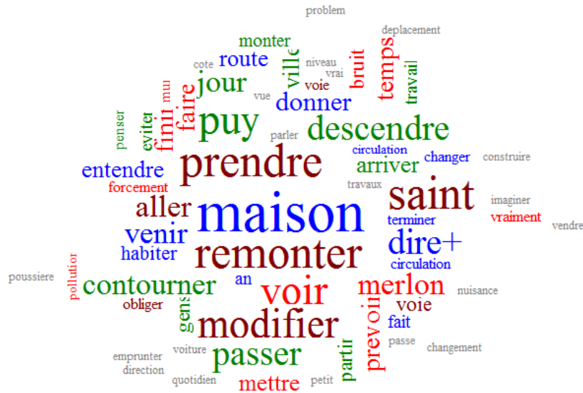
Figure 10 : Représentation graphique du corpus «Mise en circulation»

Le thème 1 (mots en rouge ) est le plus spécifique et la plus homogène. Il représente 35 % des unités textuelles classées et se caractérise par des mots tels que « voir », « merlon », « prévoir », « faire », « finir », « temps ».