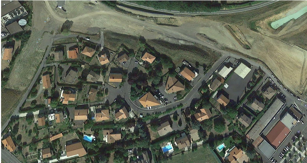
Figure 2 : Site de Genebret

Le site de Genebret : Il est constitué d'un lotissement d'une vingtaine de maisons individuelles. Les habitations se situent de 50 à 150 mètres du chantier. La source principale de vibrations sur ce site est le compactage. Il est intervenu principalement de mi-2015 à mi-2016, et à l'automne 2016.