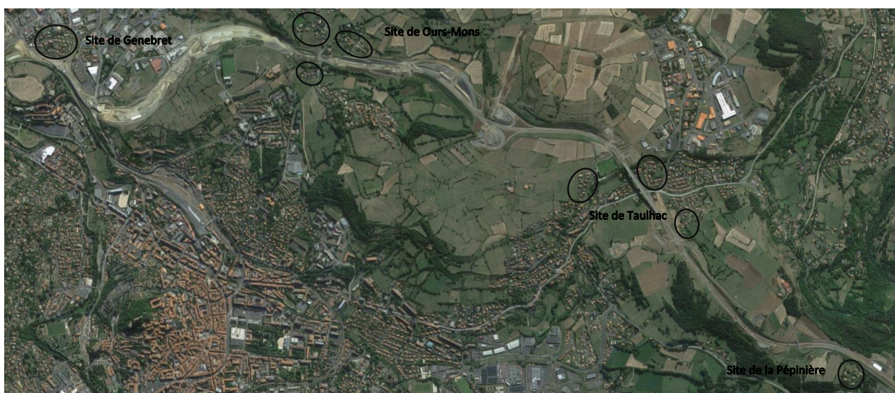
Figure 1 : Emplacements des sites le long du chantier de contournement

Au final 3 sites ont été retenus le long du chantier : Genebret, Taulhac et Ours-Mons.