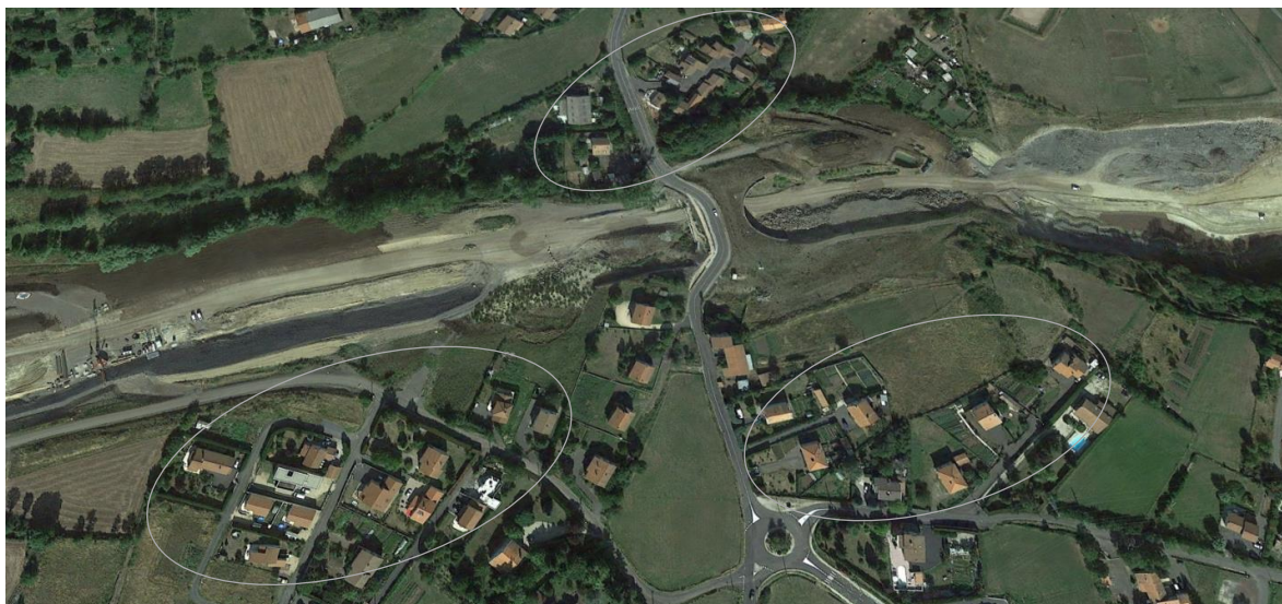
Figure 3 : Site de Ours-Mons

Le site de Ours-Mons : Il est situé de 3 zones de part et d'autre du chantier, qui comptent au total une trentaine de maisons individuelles. Elles se situent entre 50 et 250 mètres du chantier. La source principale de vibrations ont été les tirs de mine. Les travaux sur cette zone ont démarré mi 2014, la période de pics des tirs de mine a eu lieu entre avril et juin 2015.