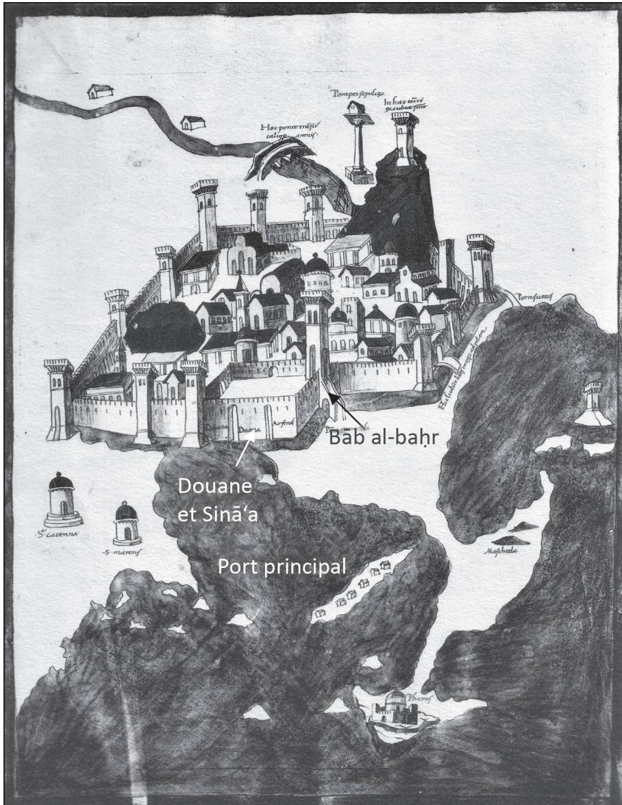
Fig. 4 - Alexandrie vers 1470 par Ugo Comminelli