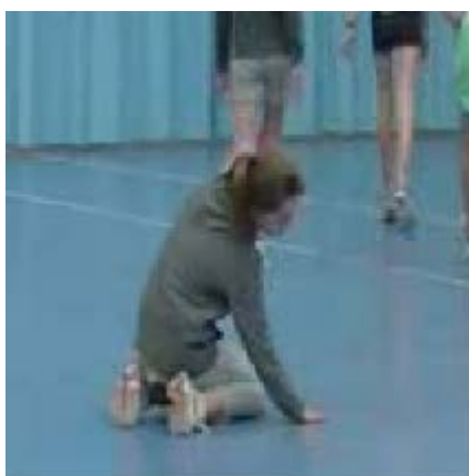
Photo 7 (zoom photo 1) - L'élève-Cendrillon lors de la représentation en scène

L'agrandissement de la photo 1 met en évidence que l'élève-Cendrillon courbe ostensiblement le dos et incline le front en frottant le sol. Certes, l'inclinaison du buste est moins ample sur scène qu'en coulisses. Mais ce trait n'est pas complètement désactivé. Elle donne l'impression de résignation, de lassitude ou de tristesse.