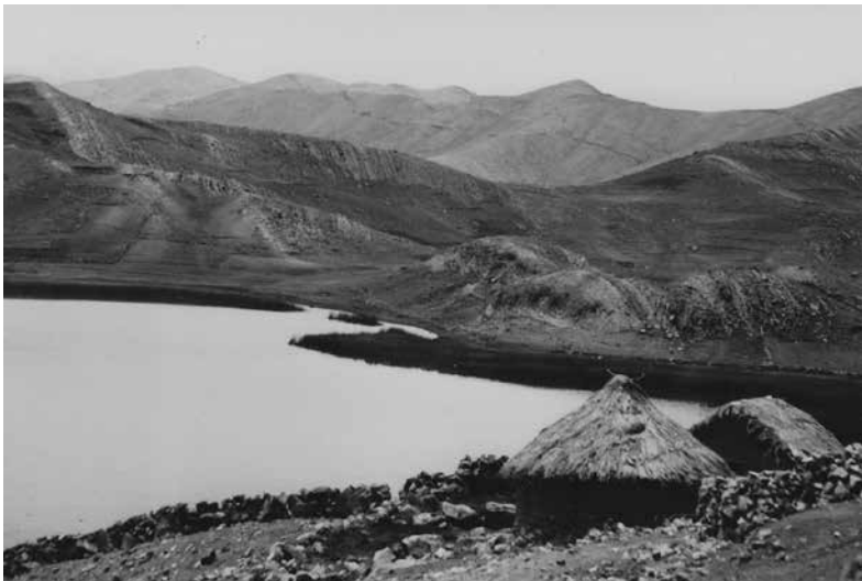
L'une des trois lagunes de Mallku Khota.