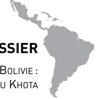
CARTE 1. LES PRINCIPALES CONCESSIONS MINIÈRES DU NORD POTOSÍ