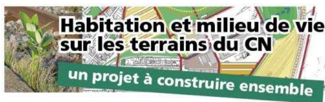
Figure 3. http://actiongardien.org/terrains-cn-nos-propositions-habitation

En juxtaposant comme sur la figure 3, de jeunes plantes qui poussent entre les rails des voies ferrées qui traversent le quartier et un extrait de la carte représentant les propositions faites pour les terrains du CN, les organisateurs donnent à voir qu’une telle cartographie requiert de tenir compte des êtres qui habitent les lieux sans que la liste de ceux-ci ne puisse être définie par avance (cf. Supra 2.2.3.1.).