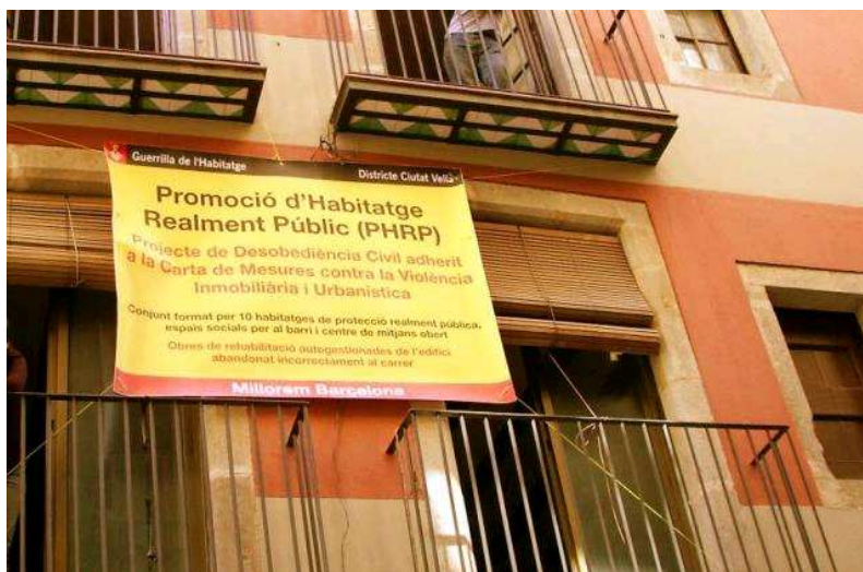
Image PHRP, 15 mai 2008, http://www.sindominio.net/phrp/?q=ca/node/95

La critique ne peut être déliée de ses modalités d'apparition dans l'espace urbain. Jusque-là on a surtout suivi son inscription sur des supports documentaires, son déploiement dans des espaces de type contre forums ou à travers des manifestations de rue. On s'intéressera maintenant à des moments où les énoncés critiques produits sont directement articulés à des gestes, à des situations où la critique trouve sa traduction pratique. Le terrain barcelonais semble exemplaire de ce souci de toujours accompagner « en actes » le travail de dénonciation.