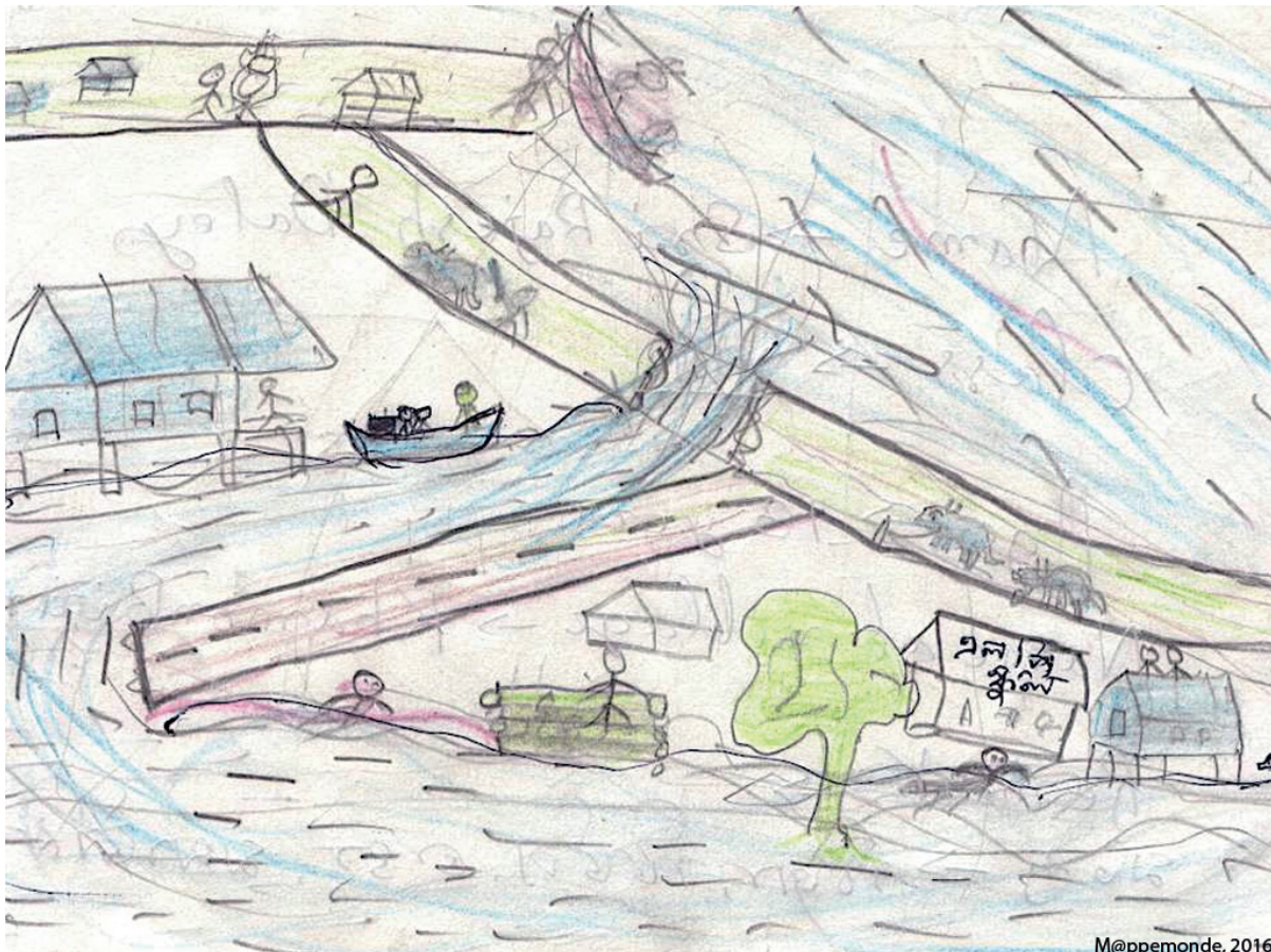
Figure 4. Naresh Doley du village d'Ekoria Matmora, en classe VIII, garçon de 13 ans : « Un paysage où flottent des troncs d'arbre, des animaux dans les eaux des inondations ».

Dans la subdivision de Dhakuakhana, voisine de Majuli, les digues furent rompues à plusieurs reprises. Au travers de leurs dessins, les élèves des écoles de Dhakuakhana (plus de 200) partagent leurs perceptions des événements et témoignent de leur vécu des inondations. Ils expriment par leurs dessins leur angoisse dans un contexte de forte vulnérabilité.