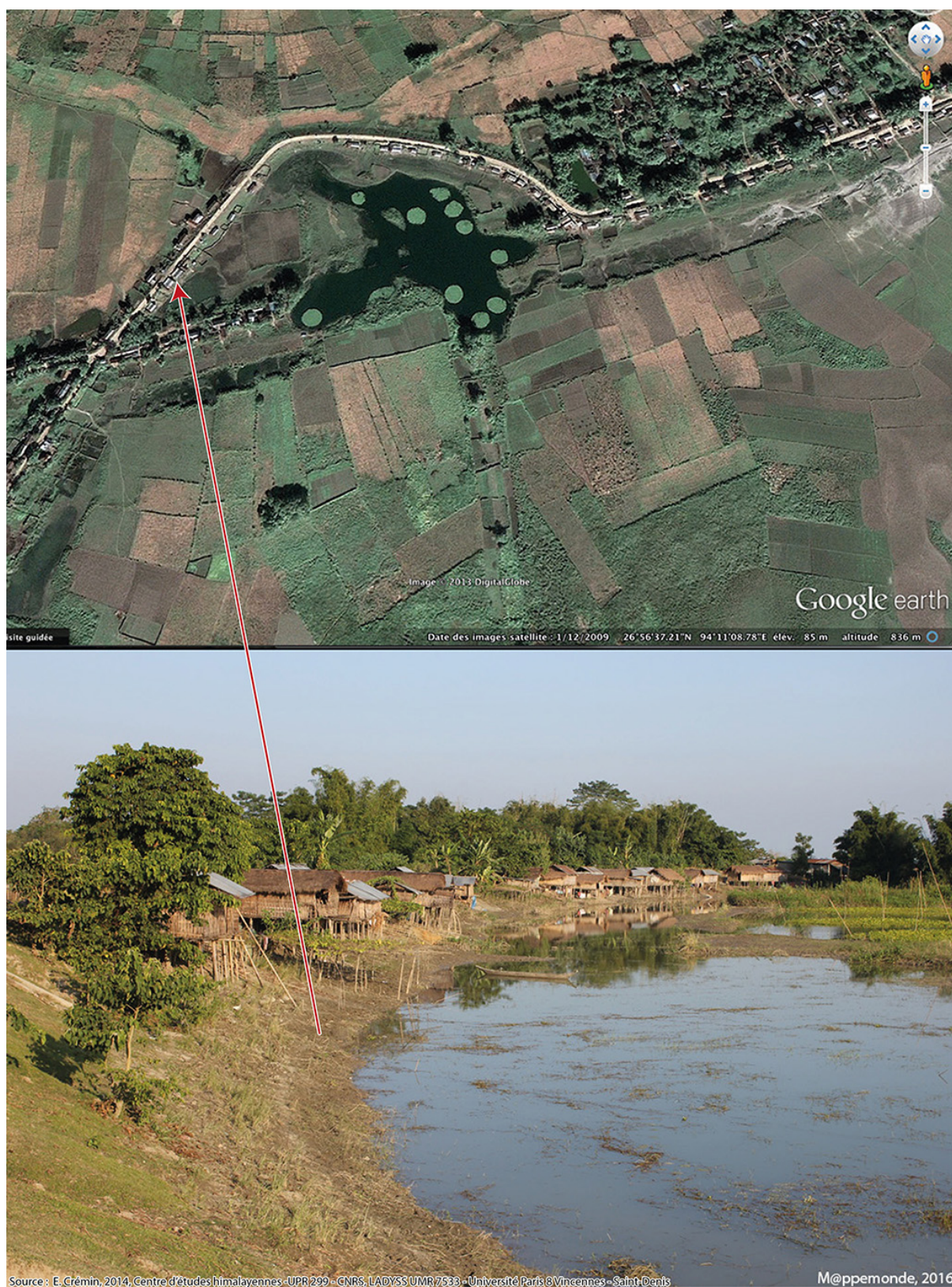
Figure 3. Les habitants de Majuli dont les terres furent érodées par le fleuve se sont déplacés le long de la digue reconstruite après avoir été rompue à plusieurs reprises.