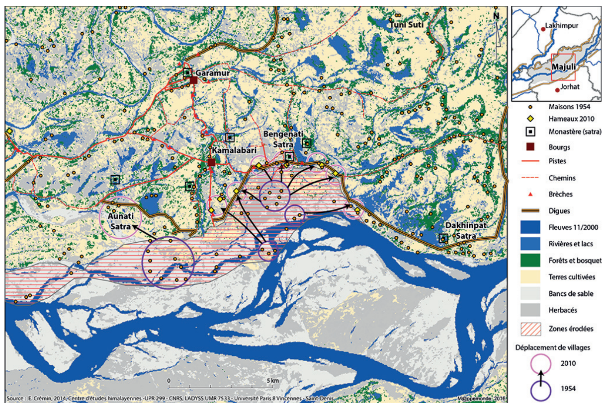
Figure 2. Carte du déplacement des villages du centre de Majuli.