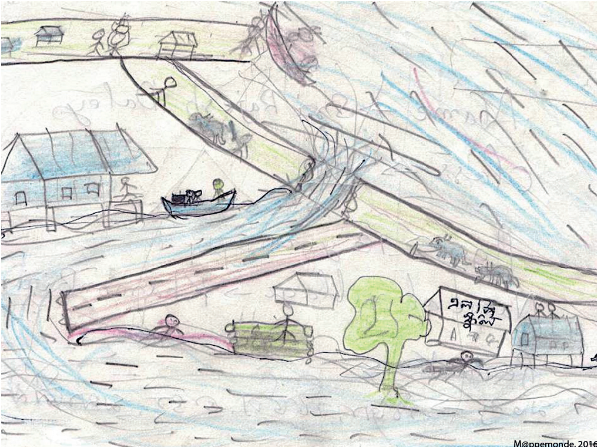
Figure 4. Naresh Doley du village d'Ekoria Matmora, en classe VIII, garçon de 13 ans : « Un paysage où flottent des troncs d'arbre, des animaux dans les eaux des inondations ».

Dans la subdivision de Dhakuakhana, voisine de Majuli, les digues furent rompues à plusieurs reprises. Au travers de leurs dessins, les élèves des écoles de Dhakuakhana (plus de 200) partagent leurs perceptions des événements et témoignent de leur vécu des inondations. Ils expriment par leurs dessins leur angoisse dans un contexte de forte vulnérabilité.